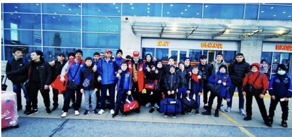
Команда Чеченской Республики на первенстве России