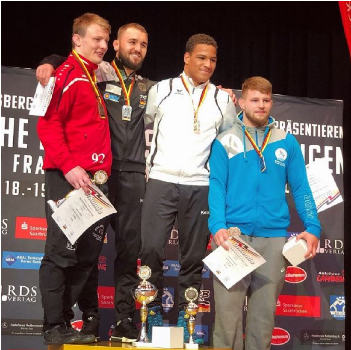
Ахмед Дударов – чемпион Германии 2019 года.