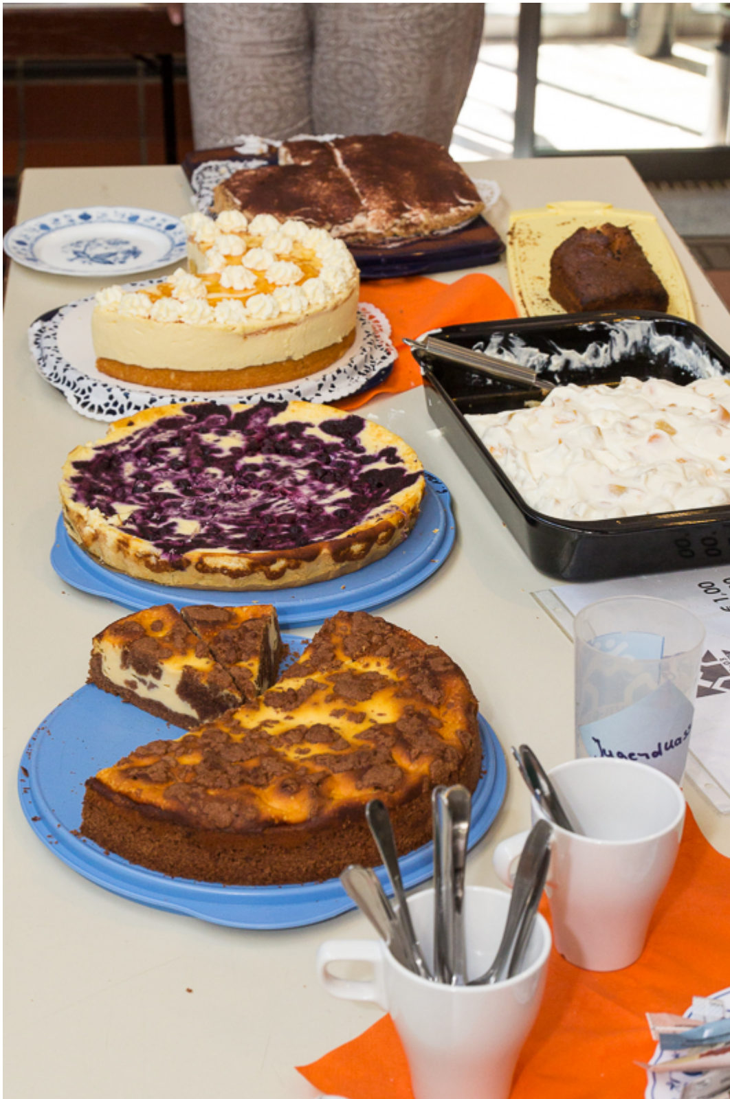
Участников вкусно кормили