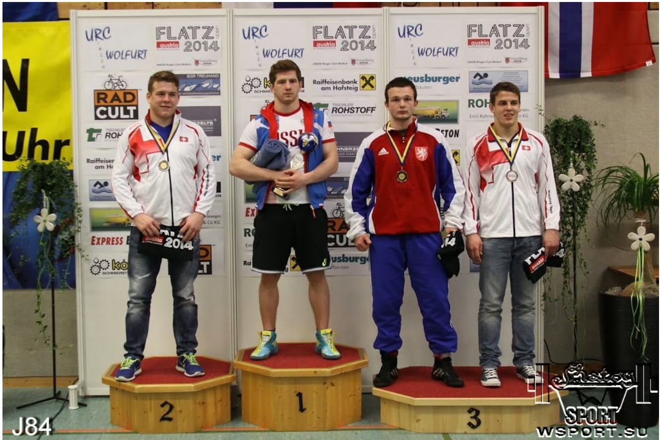
J84 Чемпион Руслан Абдулаев