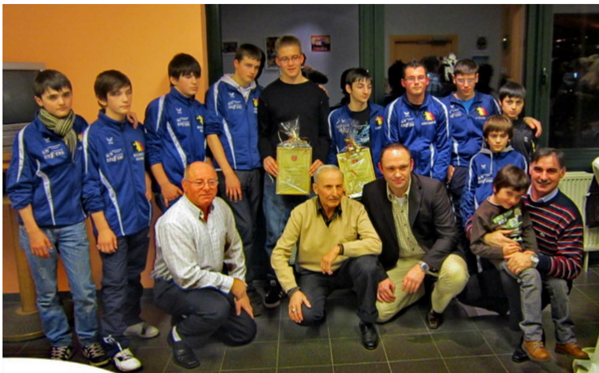
Лучший клуб 2011 года - "Раерен 2006"