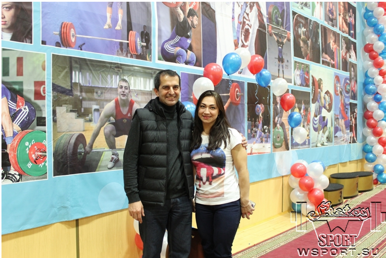
Надежда Евстюхина - 2-кратная чемпионка мира и Европы, бронзовый призер Олимпиады-2008