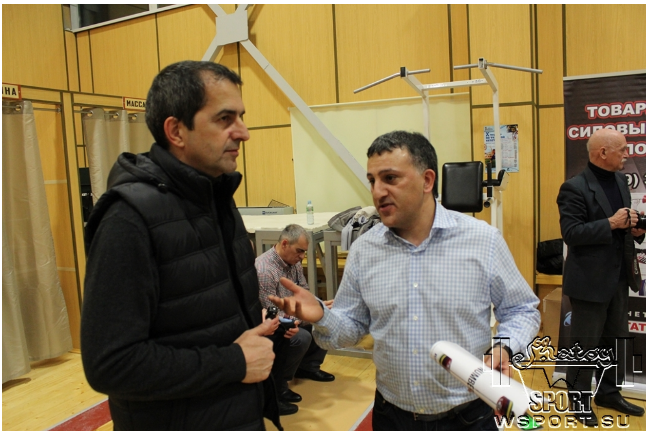
Представитель турецкой компании- производителя штанг Werksan.