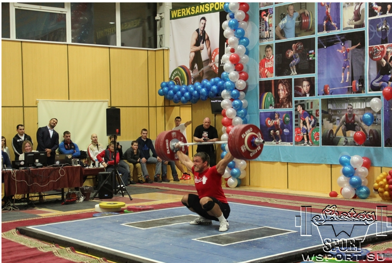
Дмитрий Клоков, 190 кг.