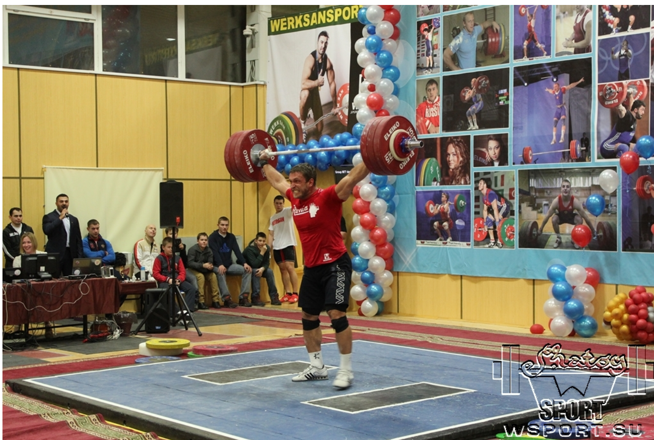
Дмитрий Клоков, 190 кг.