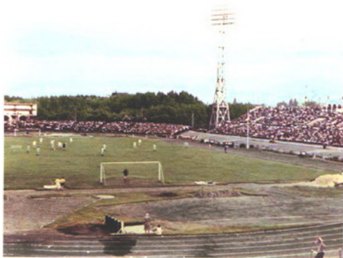
Стадион «Динамо», г. Грозный. Stadium «Dinamo», Groznyi.