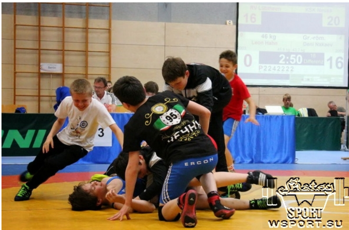
Друзья поздравляют Дени после решающей победы