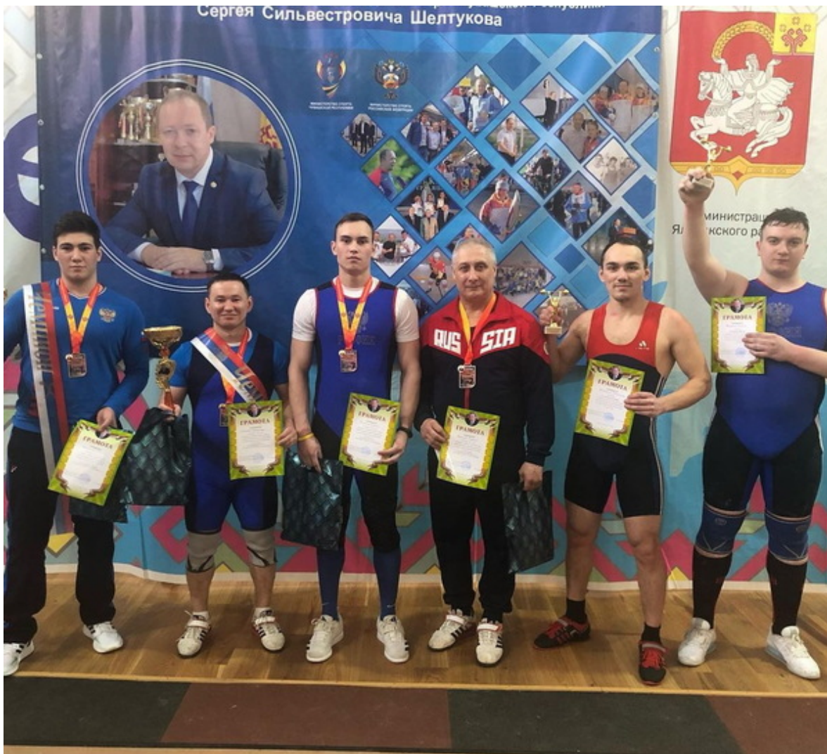
Победители в разных весовых и возрастных категориях.