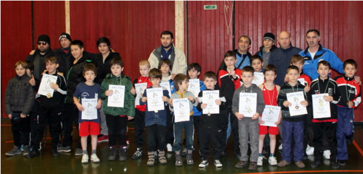
Вайнахи на соревнованиях