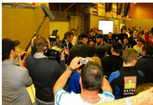
Бувайсар Сайтиев в центре внимания

Затем организаторам турнира с большим трудом удалось вернуть всех на свои места и возобновить соревнования. Но Сайтиев, естественно, оставался главной фигурой дня до самого завершения турнира. От желающих поздороваться с ним, сфотографироваться, взять автограф, просто подойти поближе и посмотреть, не было отбоя. Смертельно уставший Бувайсар (как потом выяснилось, из-за переездов он почти не спал трое суток) не отказывал во внимании никому – ни маленьким, ни взрослым. И в то же время не забывал наблюдать за соревнованиями.