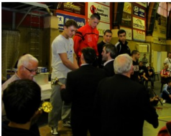
Бувайсар Сайтиев награждает призеров своей весовой категории 74 кг