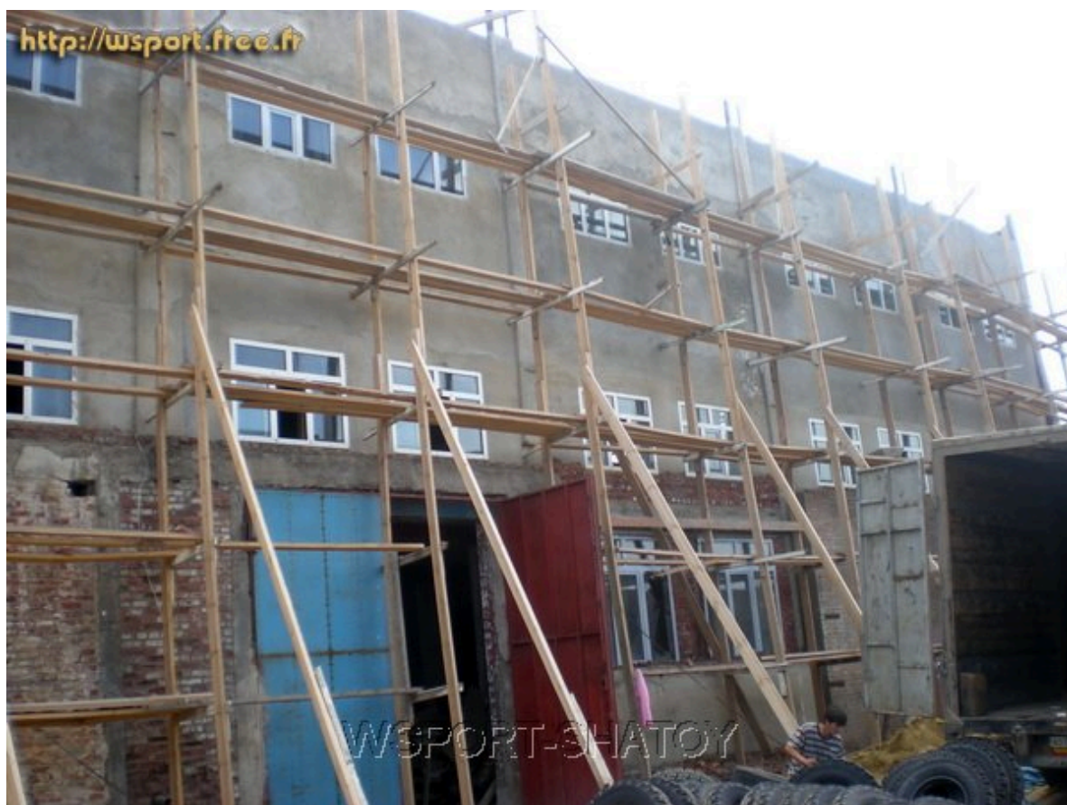
Строительство нового комплекса Школы им. братьев Сайтиевых

времени Школа им.Сайтиевых значительно расширится. Новое 3-х этажное здание будет включать в себя огромный спортивный зал, гостиницу, столовую, подсобные помещения оборудованные по последнему слову науки и техники. Перспективные дети из разных сел и районов смогут жить и тренироваться в этом комплексе.