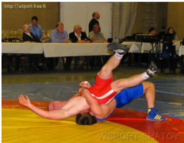
Чемпионы и призеры турнира

повел в счете, а под конец положил соперника на лопатки.