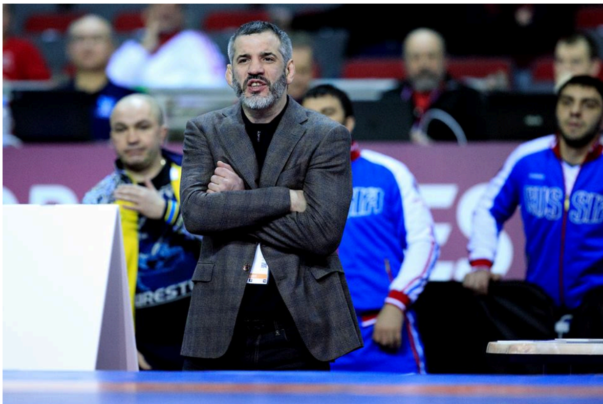
Бувайсар Сайтиев на чемпионате Европы в Риге, 9 марта 2016г.

Желаем Бувайсару Сайтиеву счастья и успехов в работе на благо чеченского спорта.