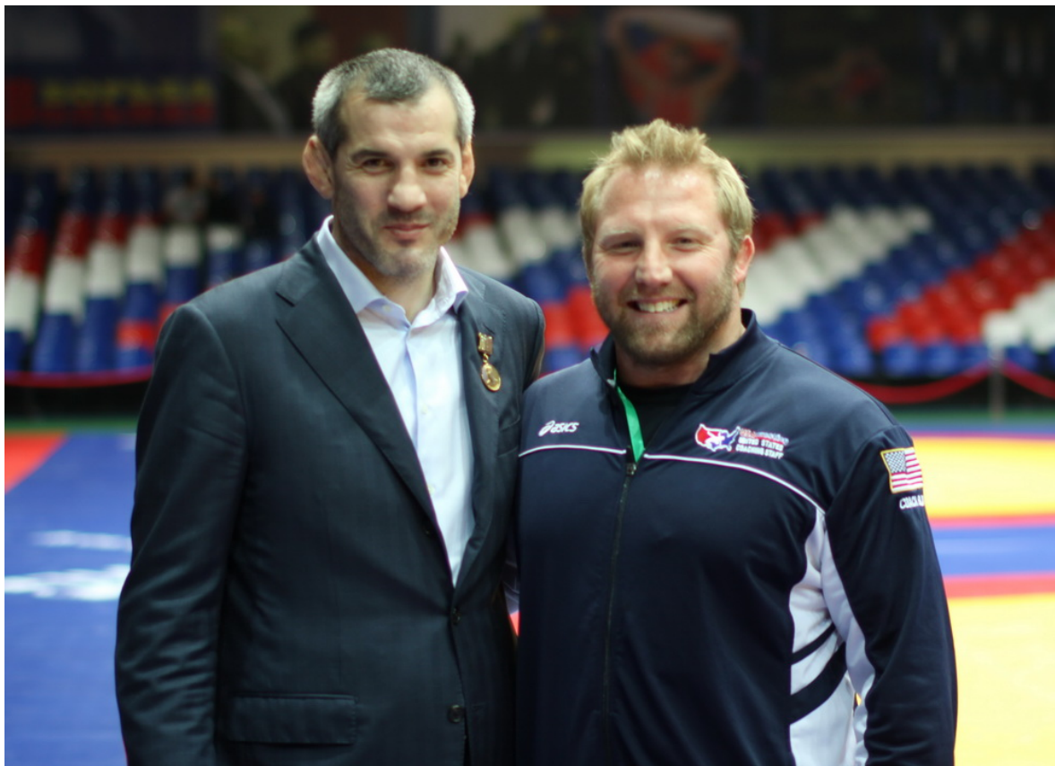
Бувайсар Сайтиев и Брэндон Слэй в Грозном