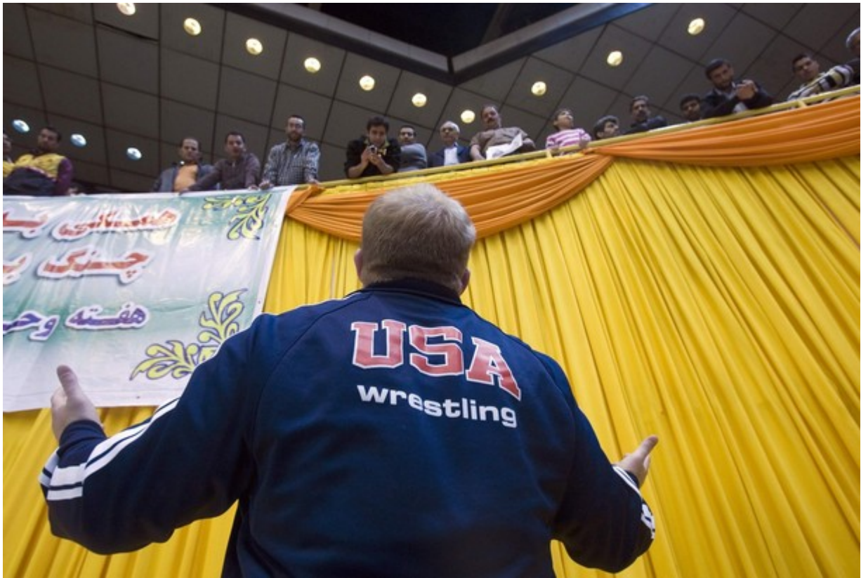
Тренер команды США Брэндон Слэй разговаривает с иранскими болельщиками, 2009г.