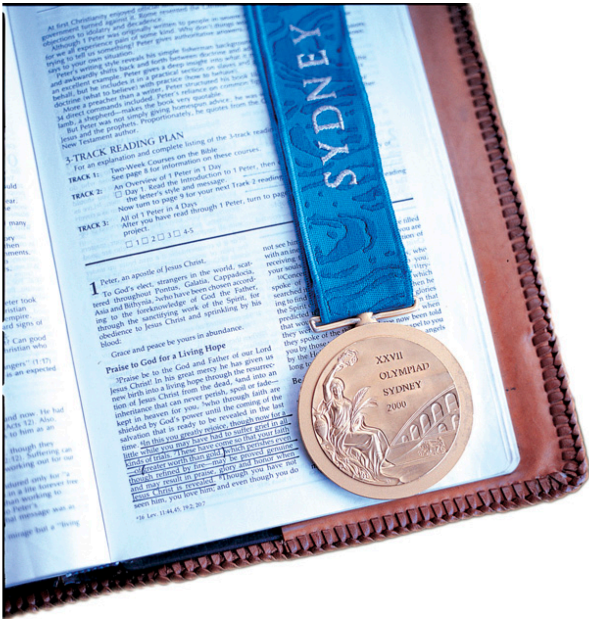
Библия Брэндона Слэя с олимпийской медалью