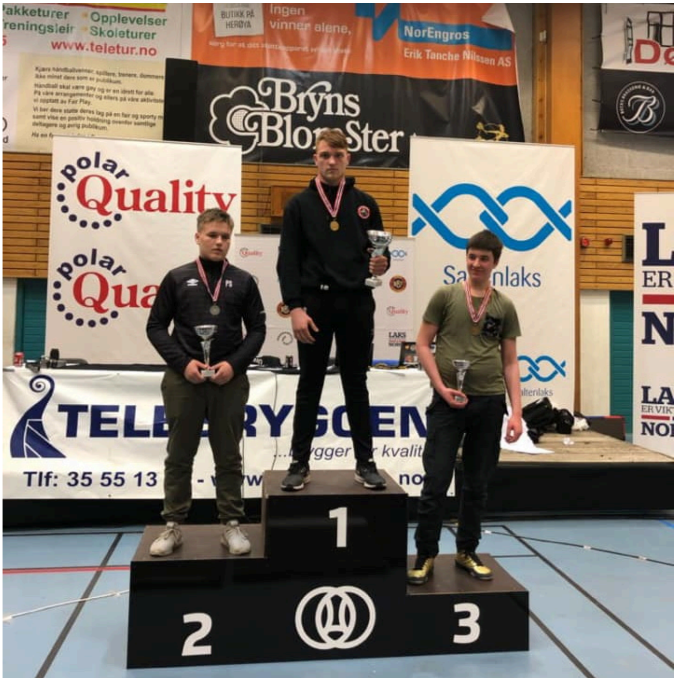
Чемпион Норвегии Ислам Шолдаев