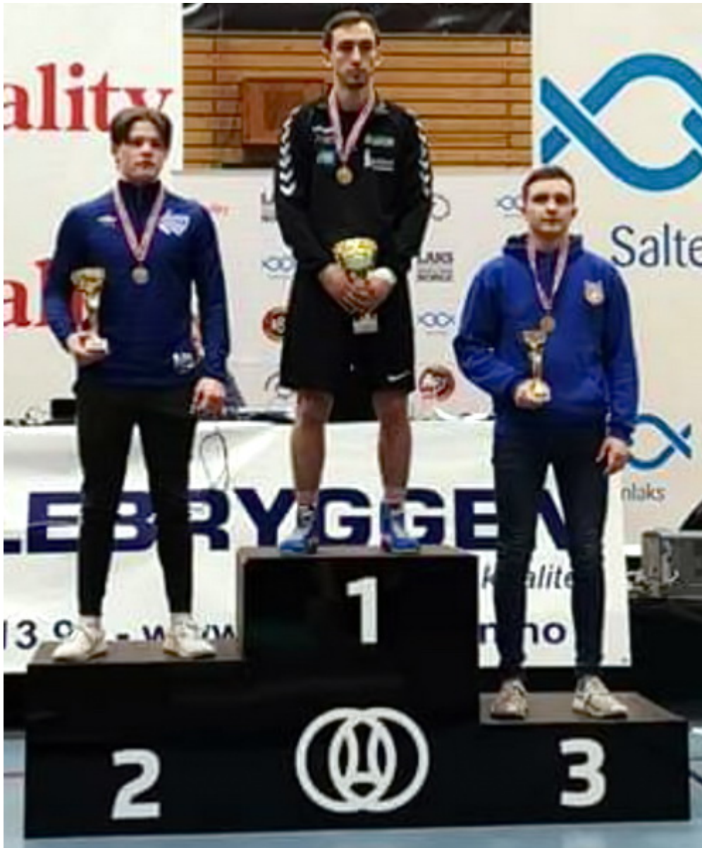
Чемпион Норвегии Азир Дзортов