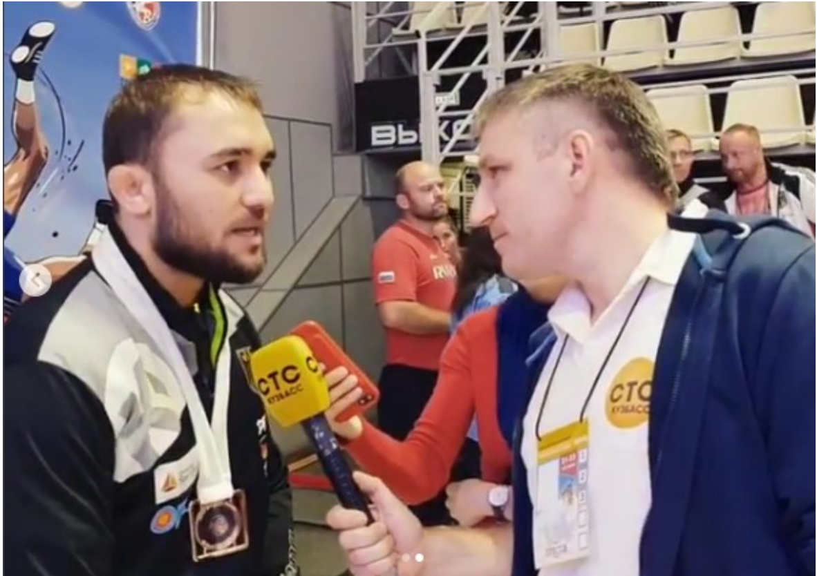
Ахмед Дударов в Кемерово