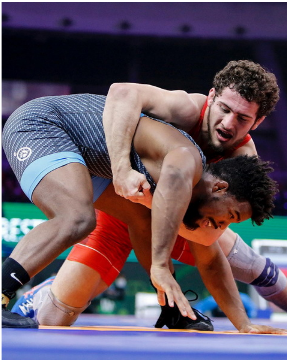
Разамбек Жамалов и Франк Чамизо