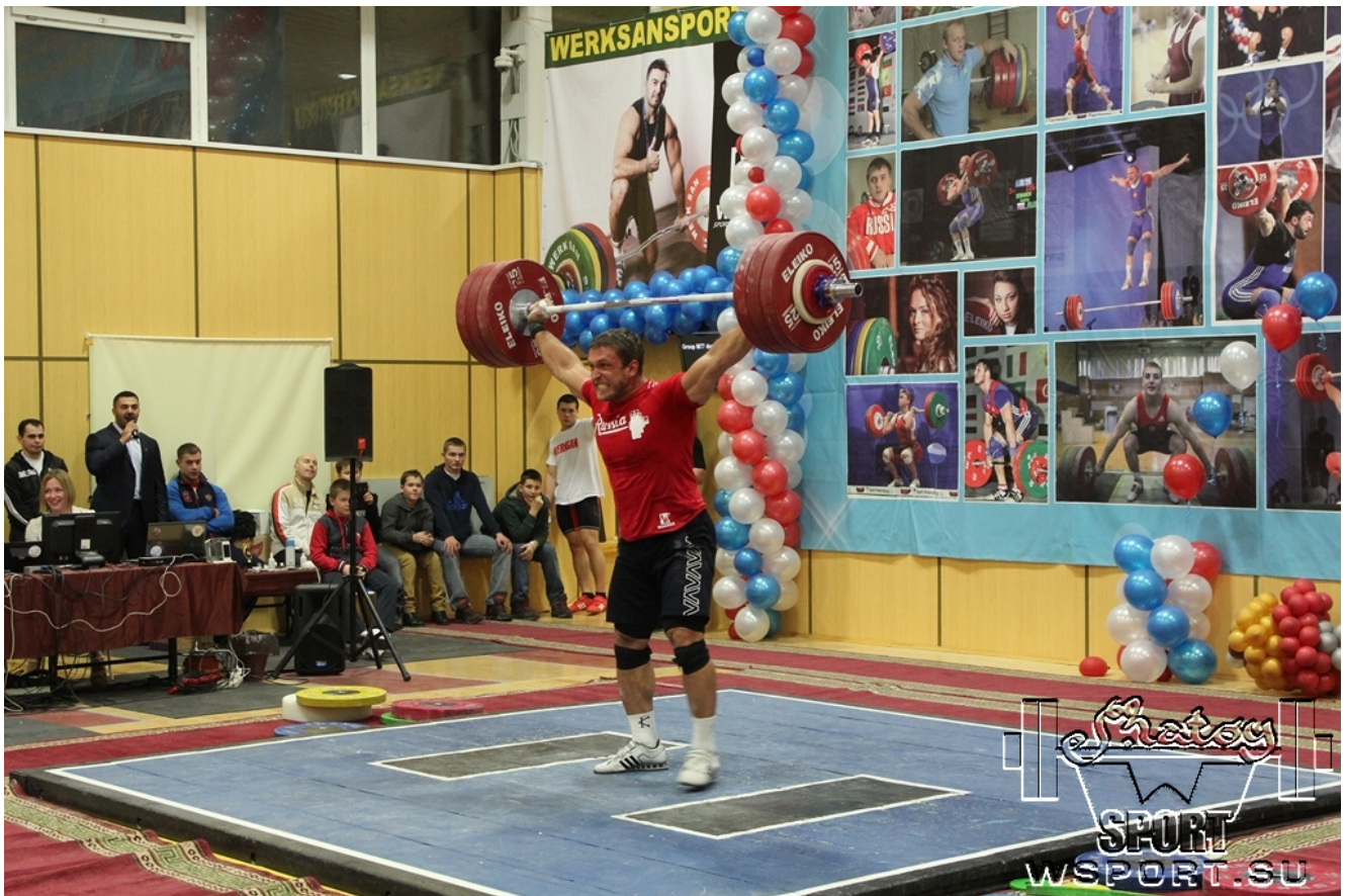
Дмитрий Клоков, 190 кг.