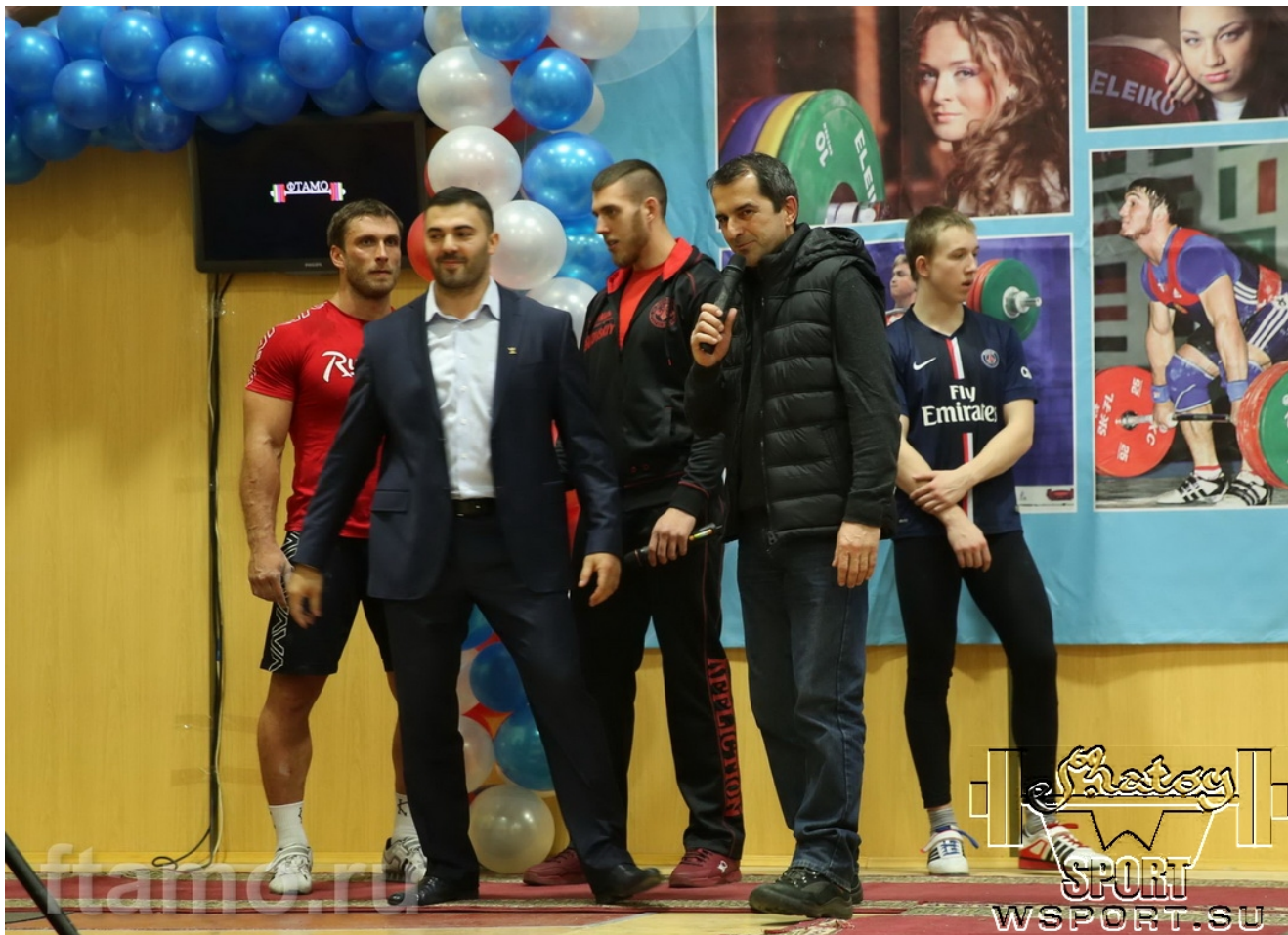
Награждение призеров турнира WSPORT-SHATOY