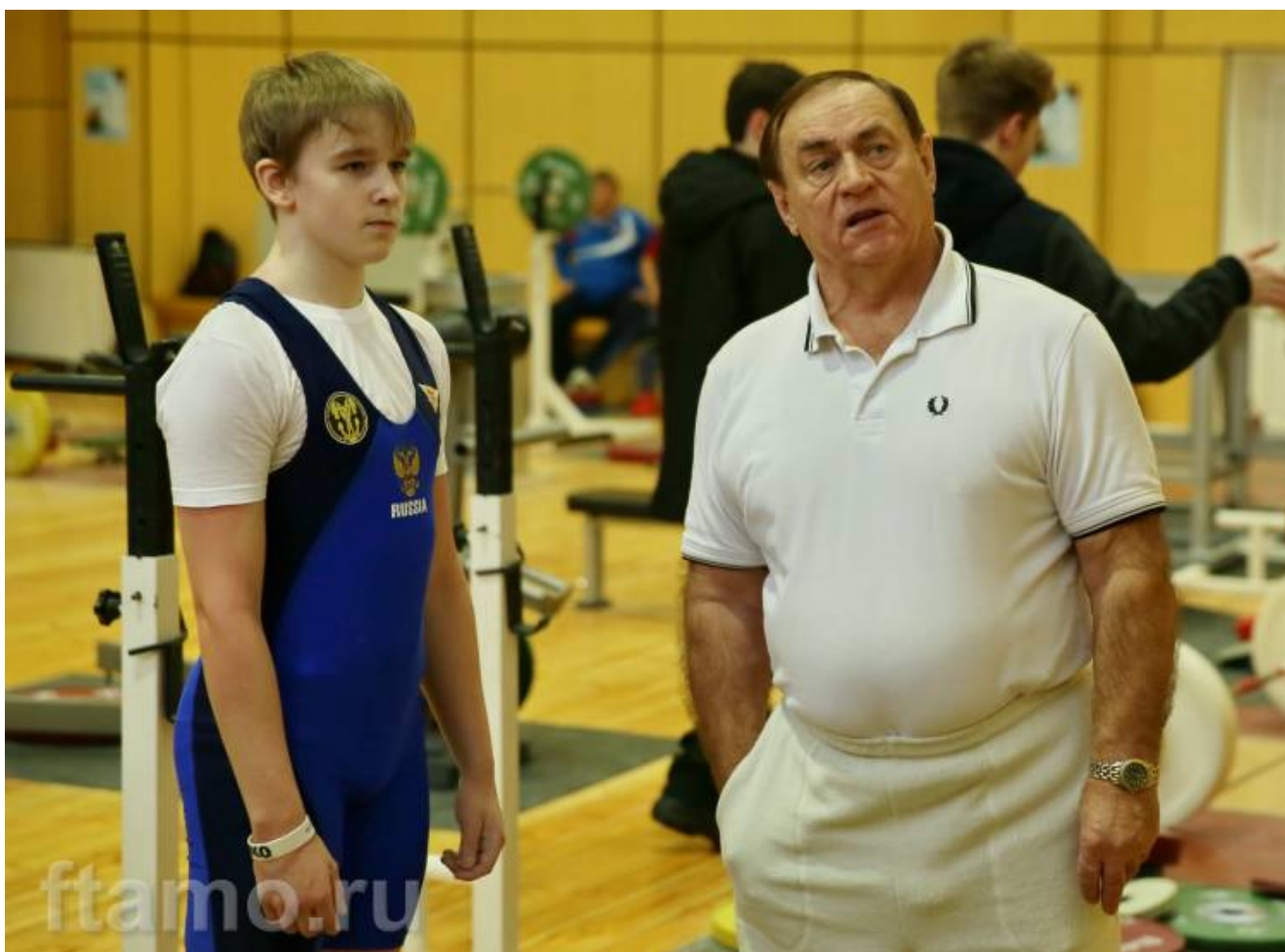
Почетный форумчанин сайта, заслуженный тренер СССР Олег