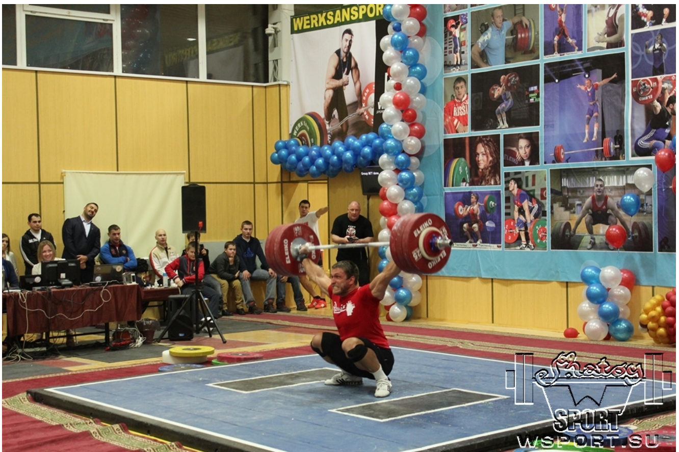
Дмитрий Клоков, 190 кг.