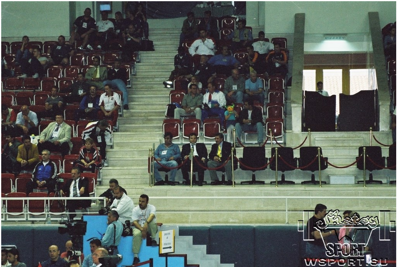
Великий Наим Сулейман-Оглу