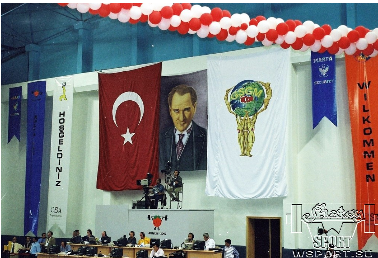
Под оком Ататюрка