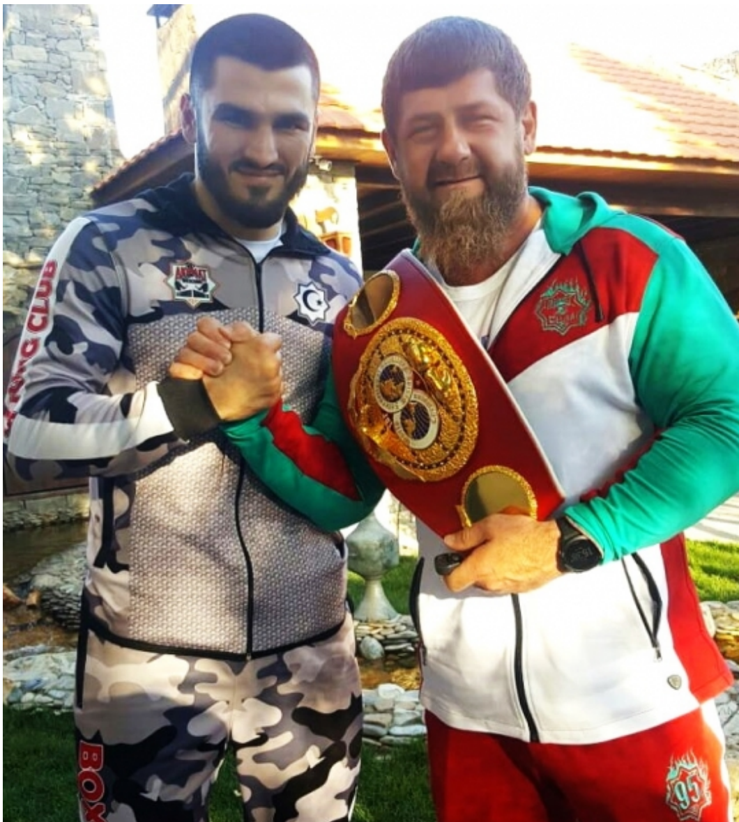
Артур Бетербиев и Рамзан Кадыров