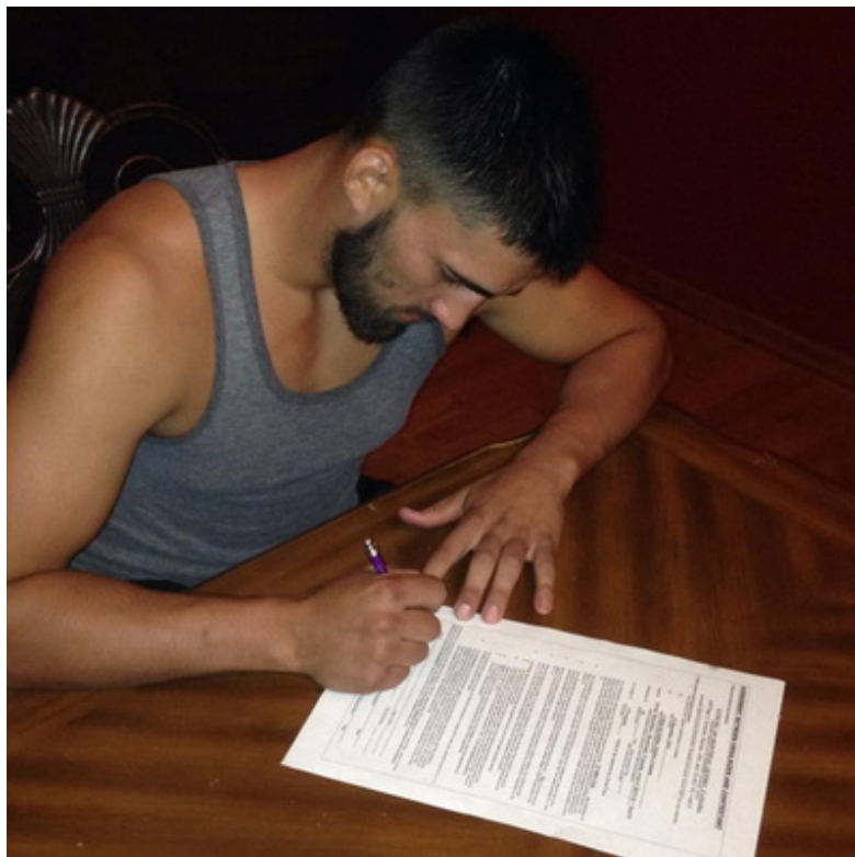
Джефф Пэйдж подписывает контракт на бой с Бетербиевым