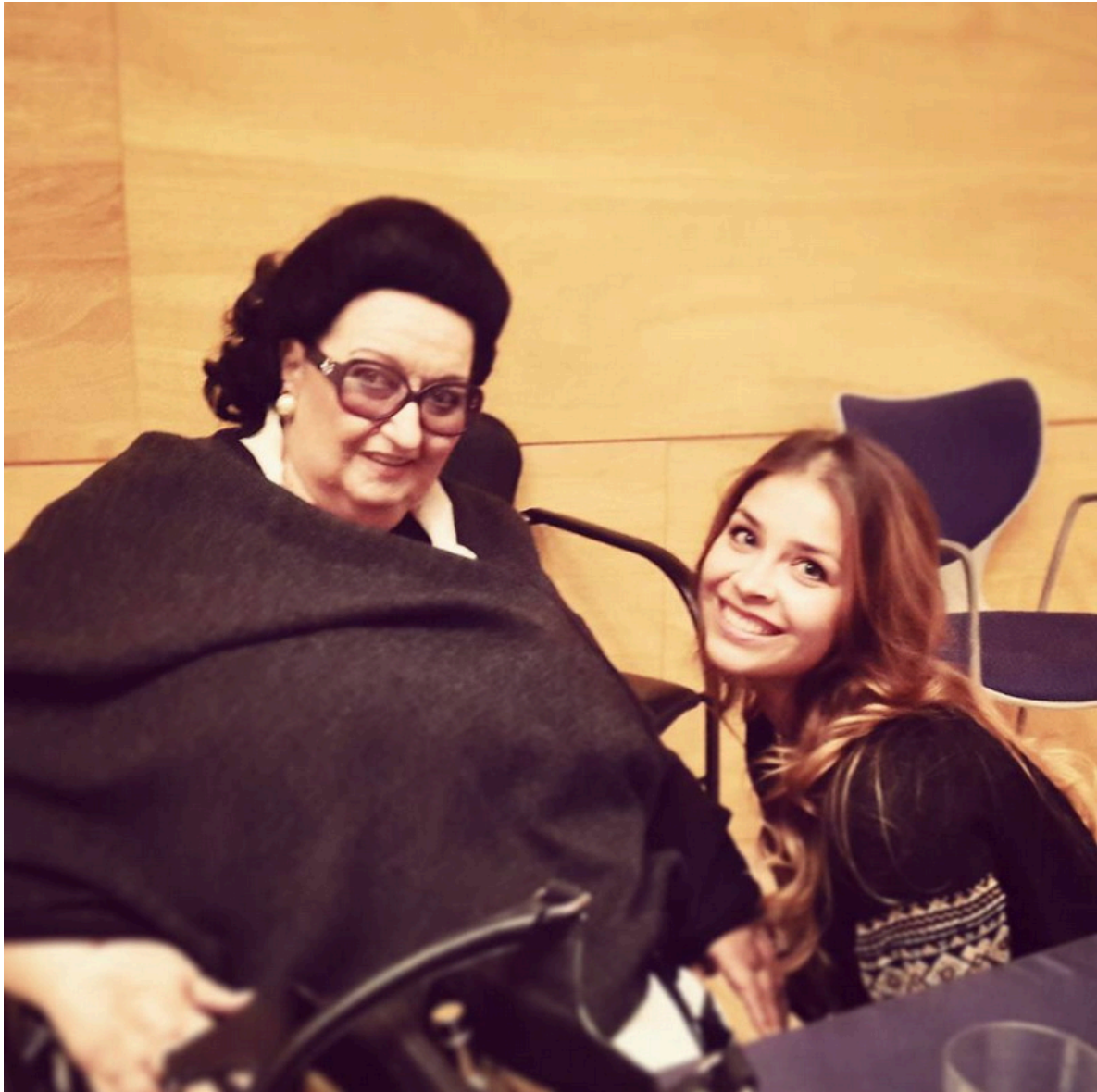
С великой Монсеррат Кабалье.