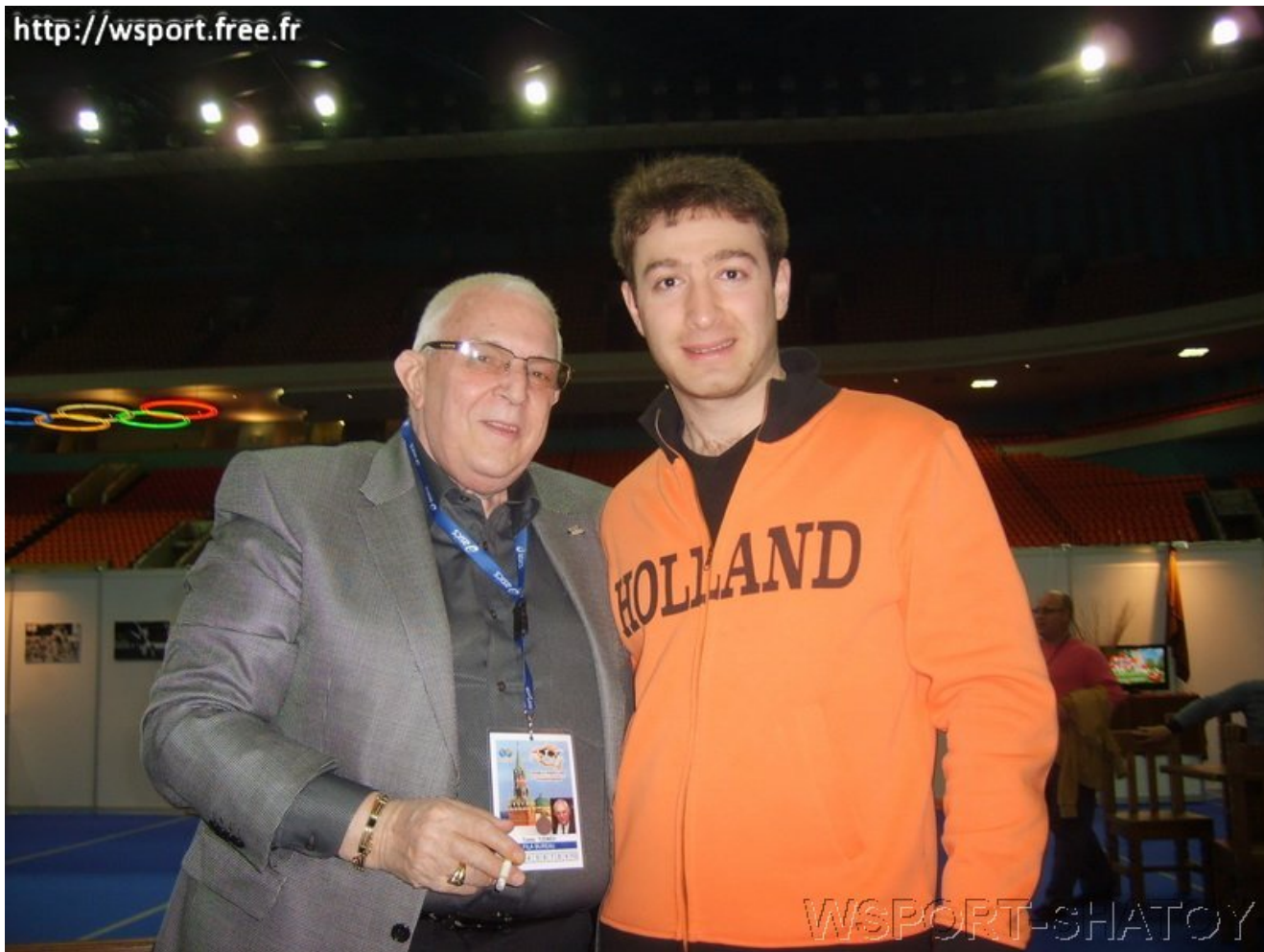
Президент Европейского Совета по борьбе CEJA Цено Ценов