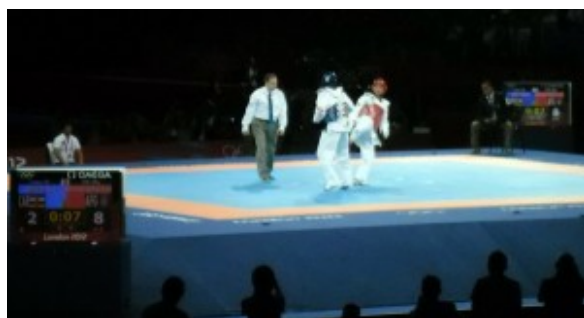
Соревнования по тхэквондо

Я заметил, что на всех соревнованиях в зале были пустые места, сто свободных мест бывало точно (специально подсчитал). В то же время на улице перед ECHEL всегда стояли люди без билетов. В кассах билеты невозможно было купить, только через интернет, хотя и на сайте Олимпиады практически невозможно было приобрести билеты.