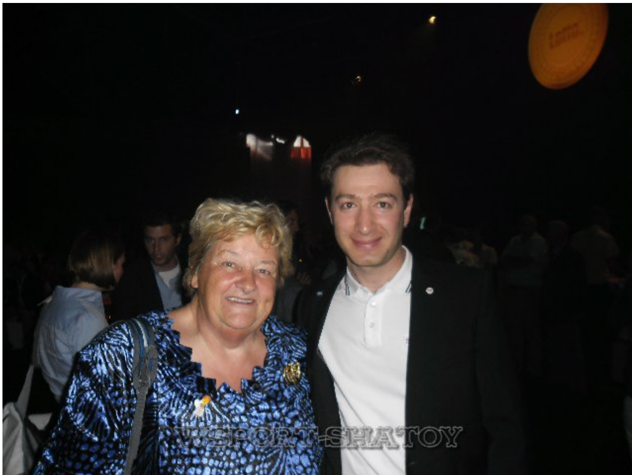
Эрика Терптстра, бывший президент Олимпийского комитета Голландии, серебряный и бронзовый призёр Олимпиады-1964 в Токио по плаванию