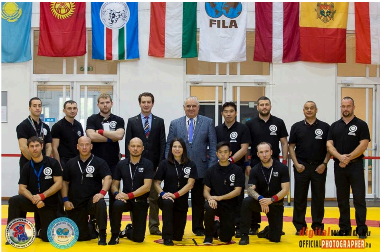
Судьи перед чемпионатом