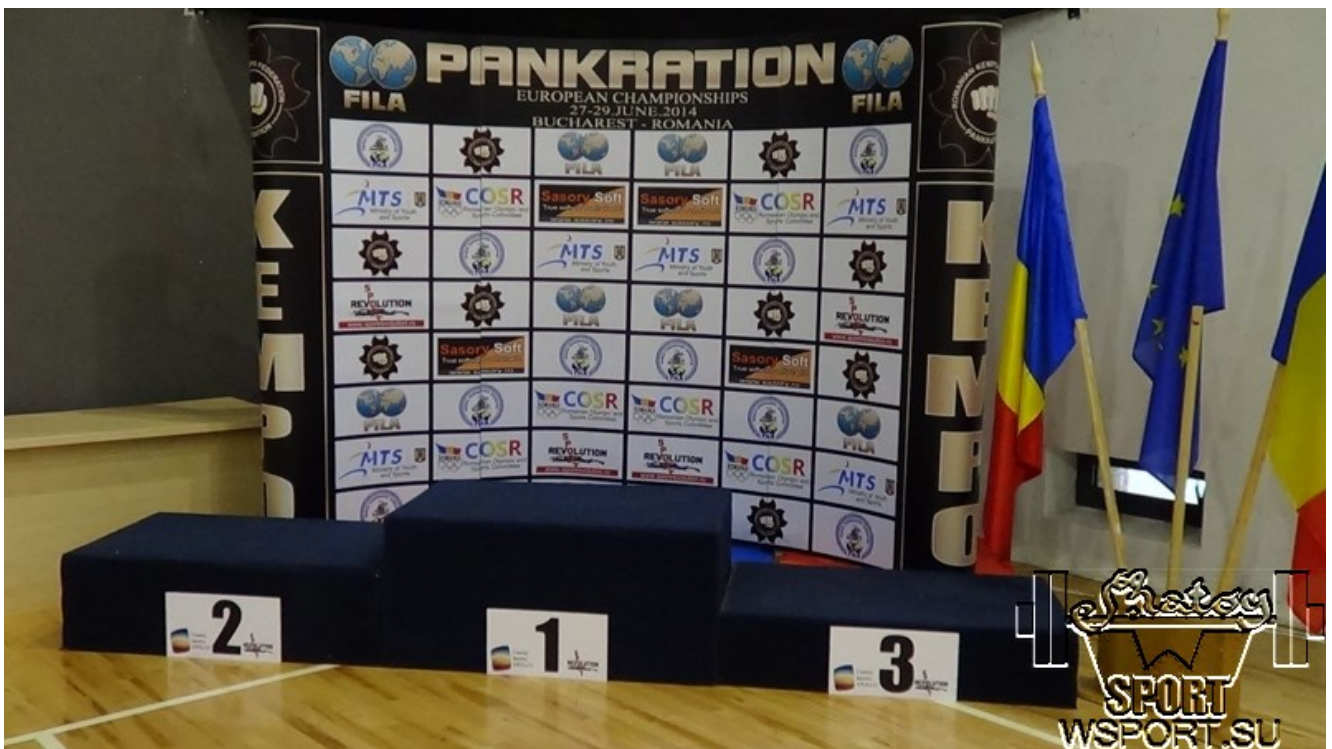
Пьедестал ждет призеров