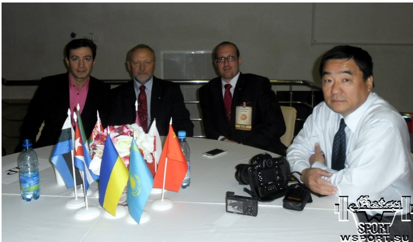
Айдамир Абдулаев, Гинтаутас Вилейта (почетный президент МФБА, Литва), Урош Йованович (международный судья, Сербия) и Хидео Камага (Президент Японской Федерации Кураша)