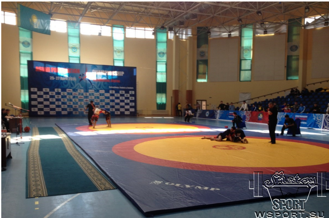
1-й день Чемпионата - Pankration Submission.