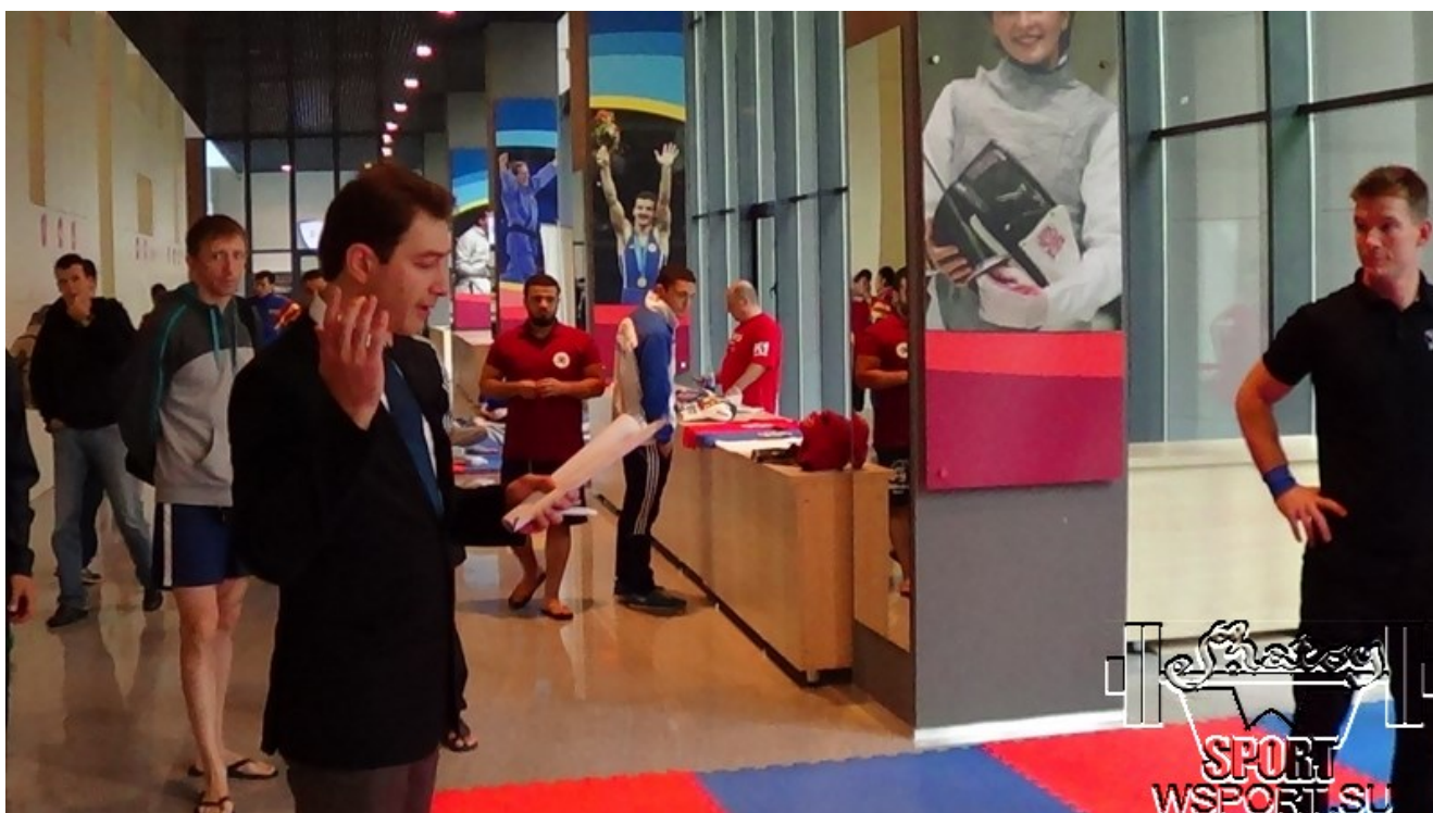
Практический курс для судей и спортсменов