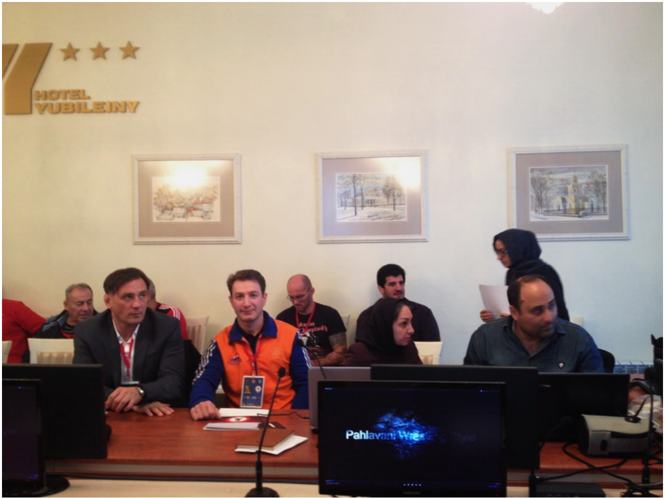
Делегат на конференции IPWF