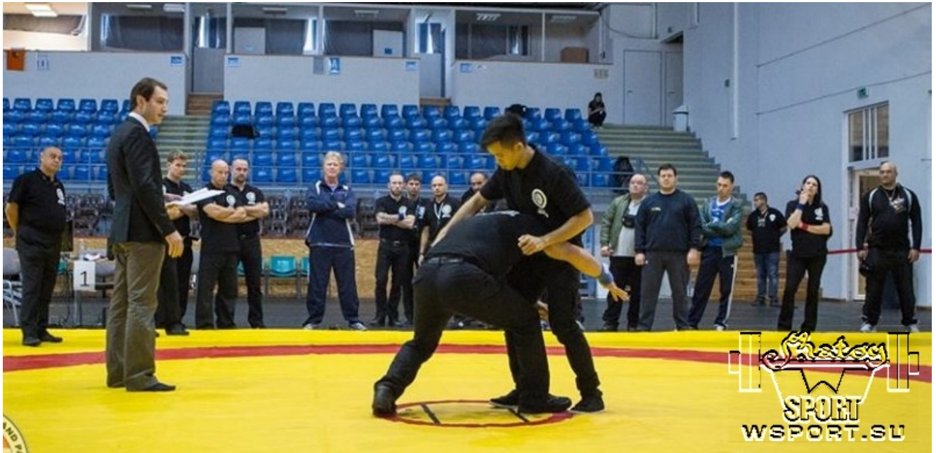
Практика судей на ковре