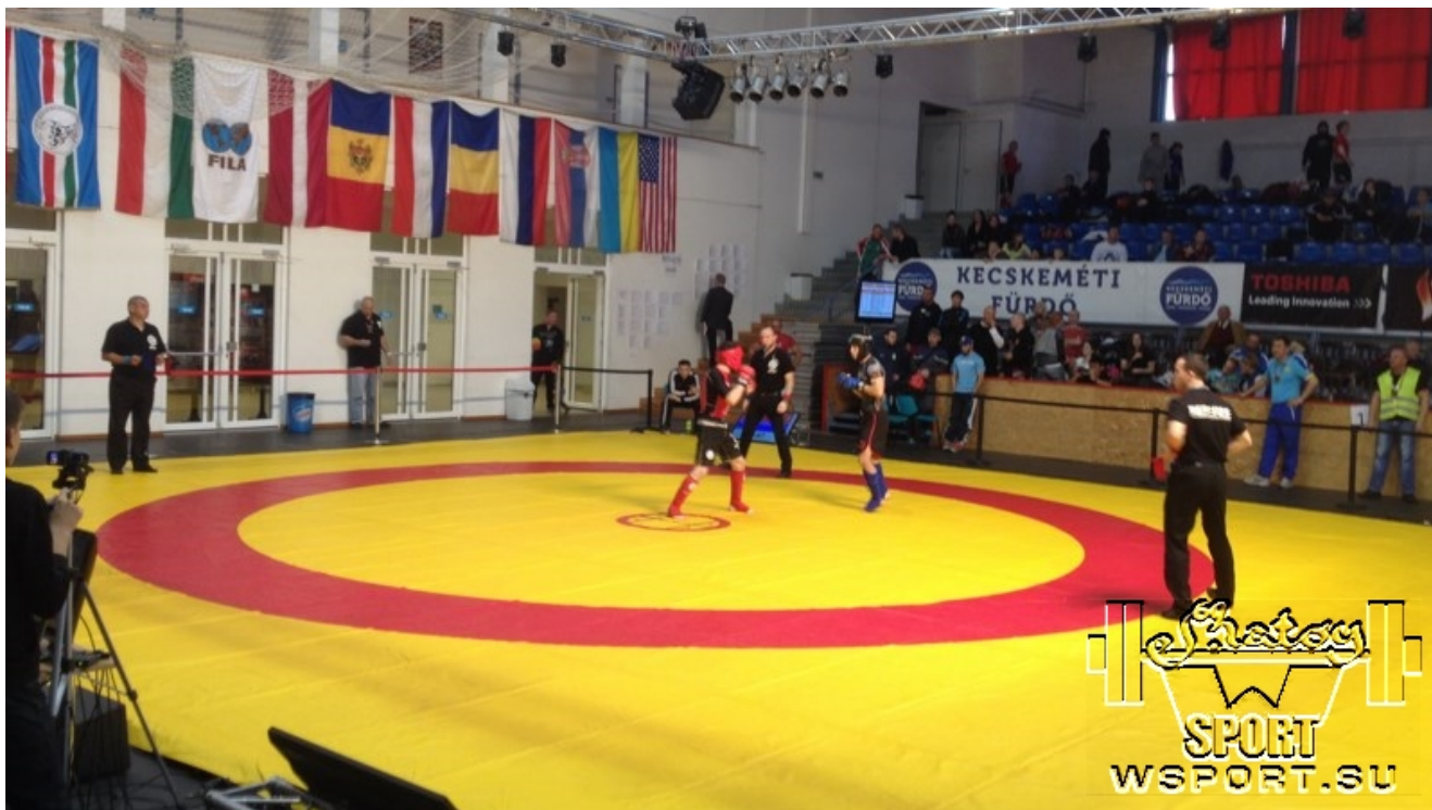
3-й день соревнований Traditional B