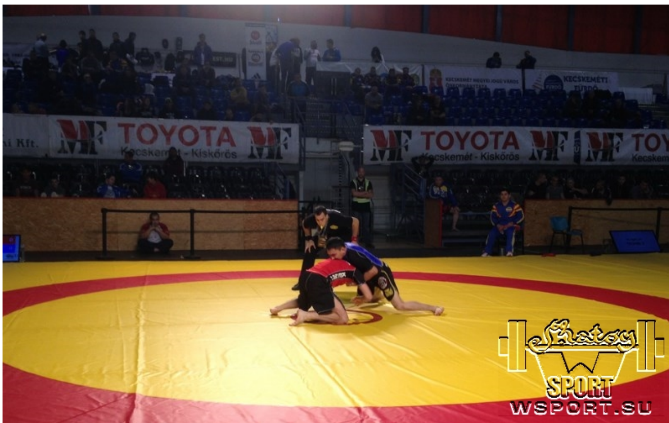
1-й день соревнований Submission