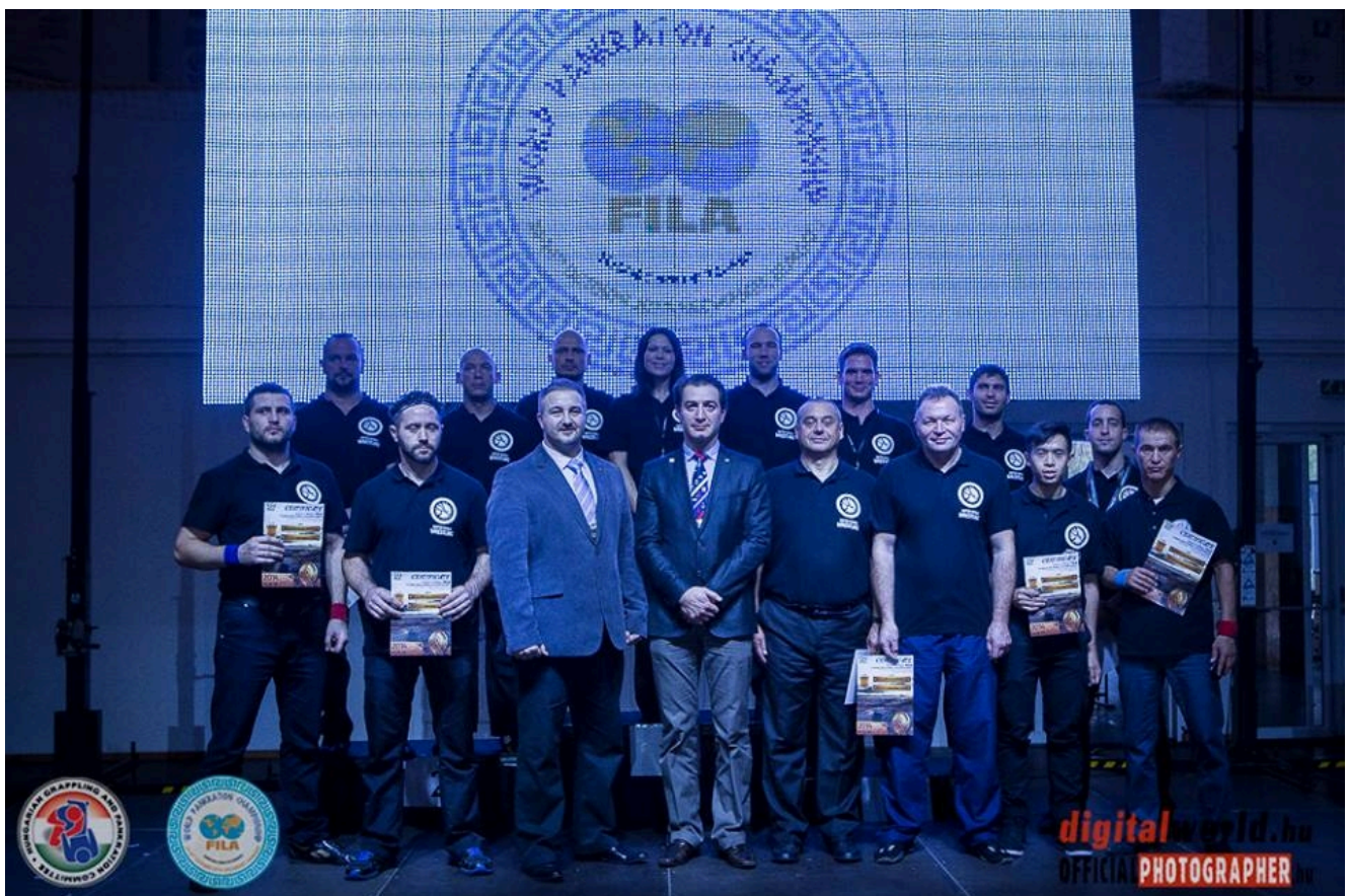
Судьи после соревнований