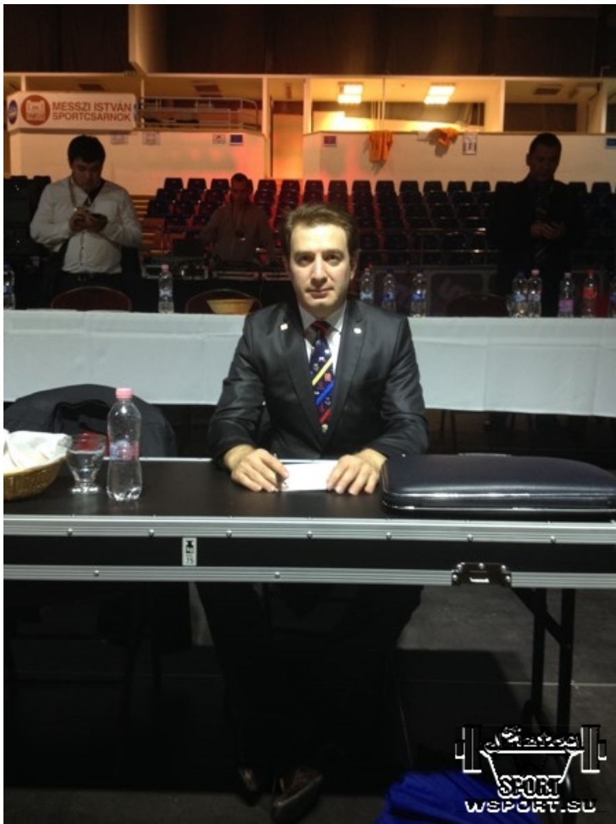
Главный судья чемпионата мира Айдамир Абдулаев