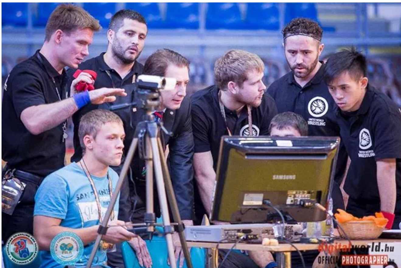
Рассмотр спорного момента