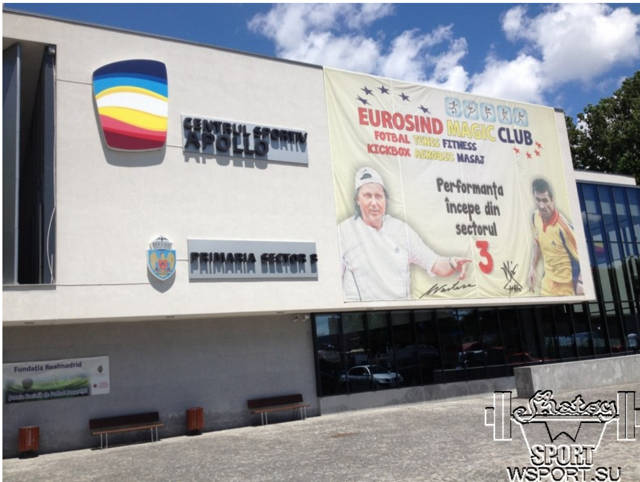
Зал соревнований (снаружи).