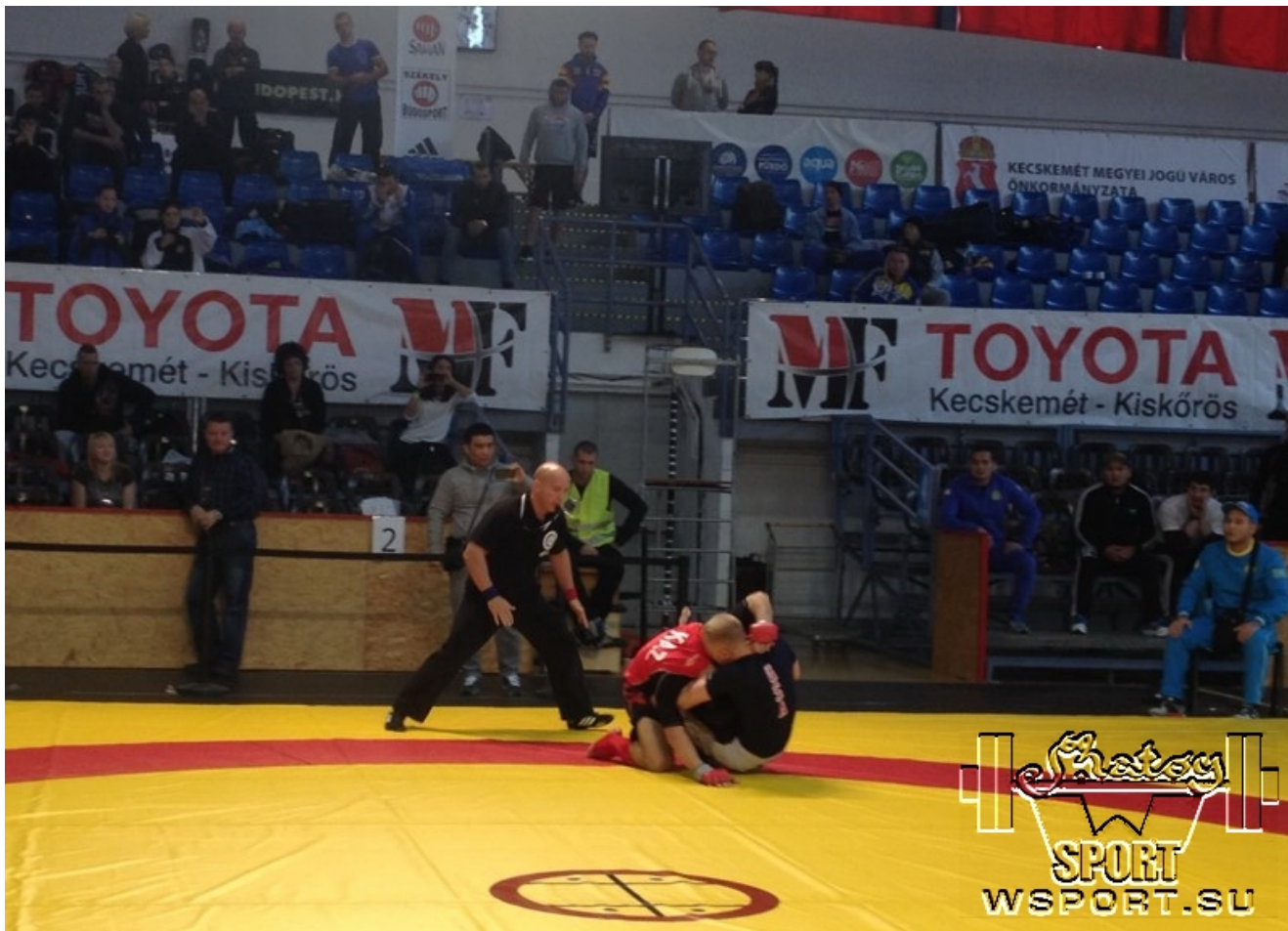
2-й день соревнований Traditional A