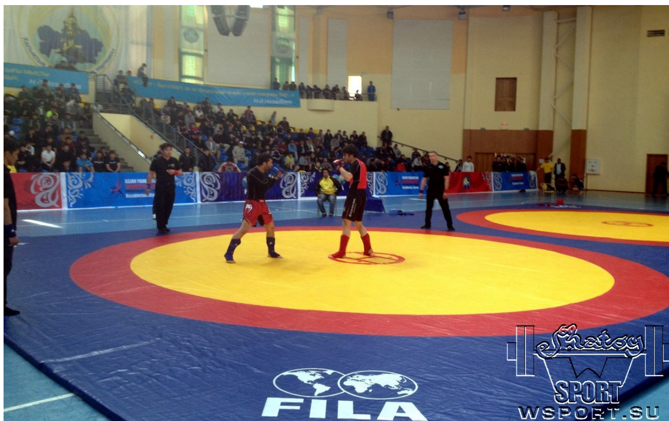
1-й день Чемпионата - Pankration Submission.