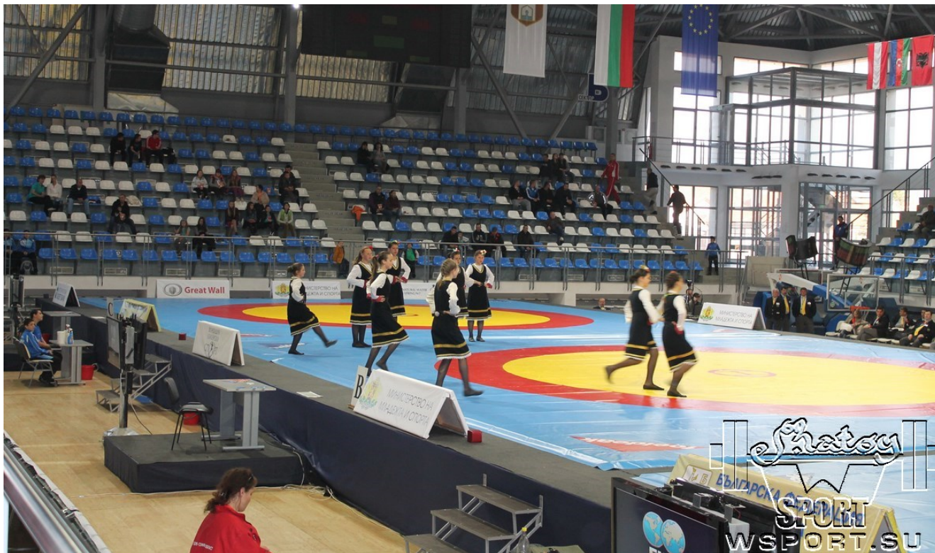
Открытие чемпионата. Зрителей немного.