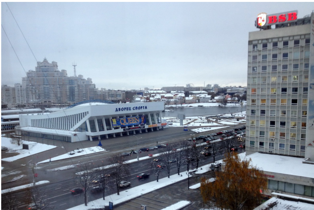
Дворец спорта, где проходил чемпионат мира по пахлавани