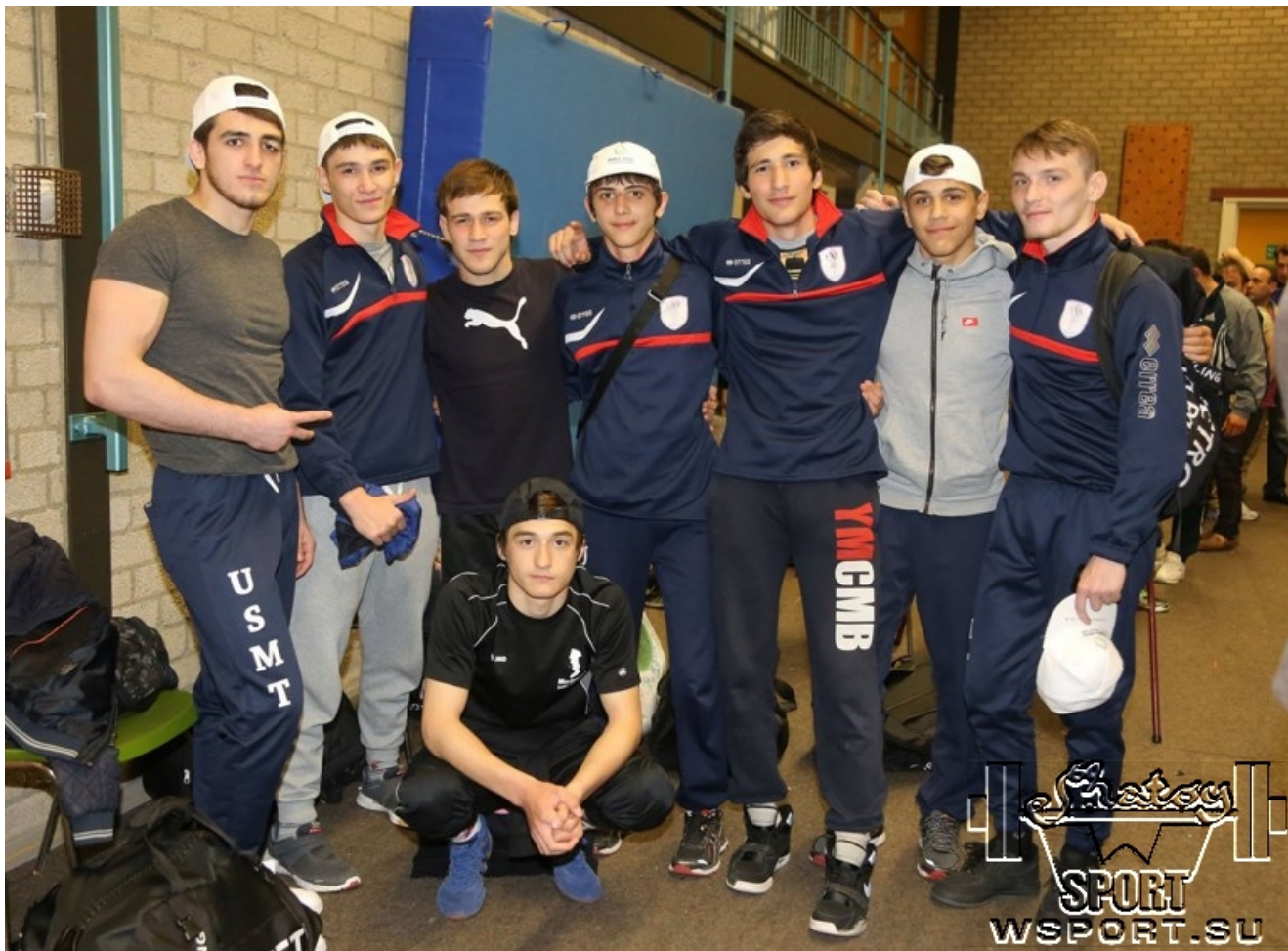
Команда из Франции