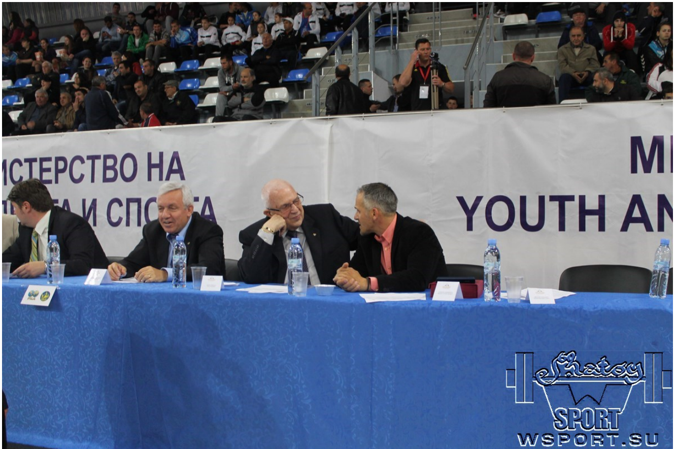
Президент Европейского Совета по борьбе Цена Ценов.