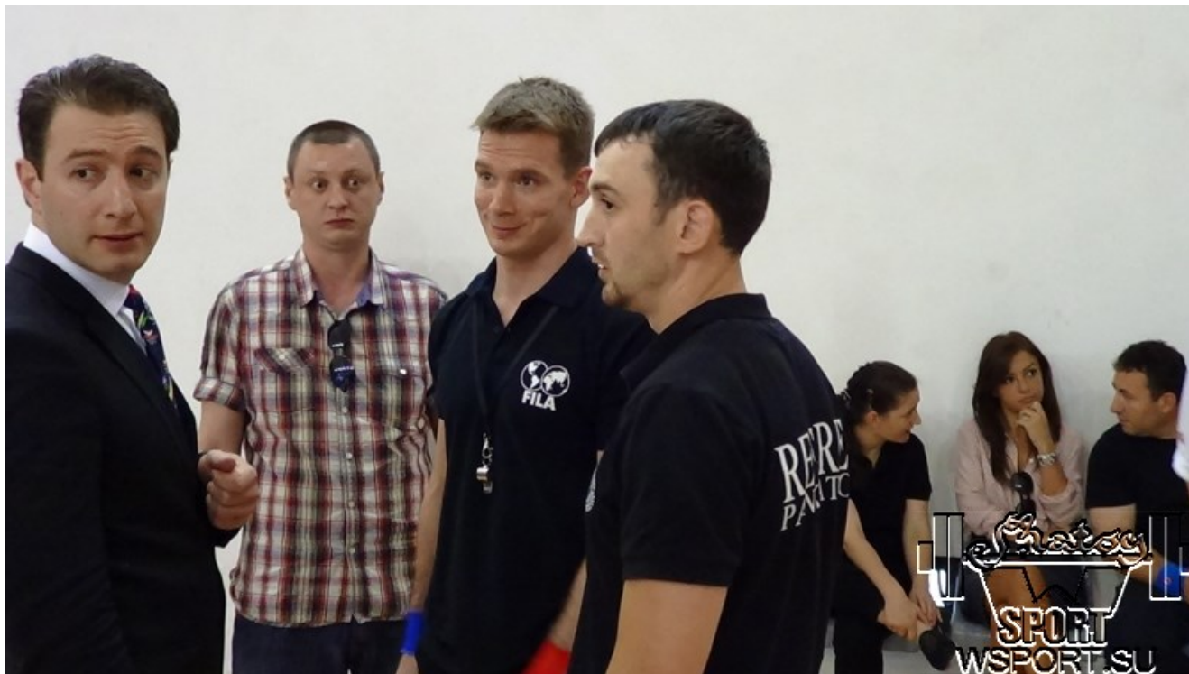
Обсуждение спорного момента