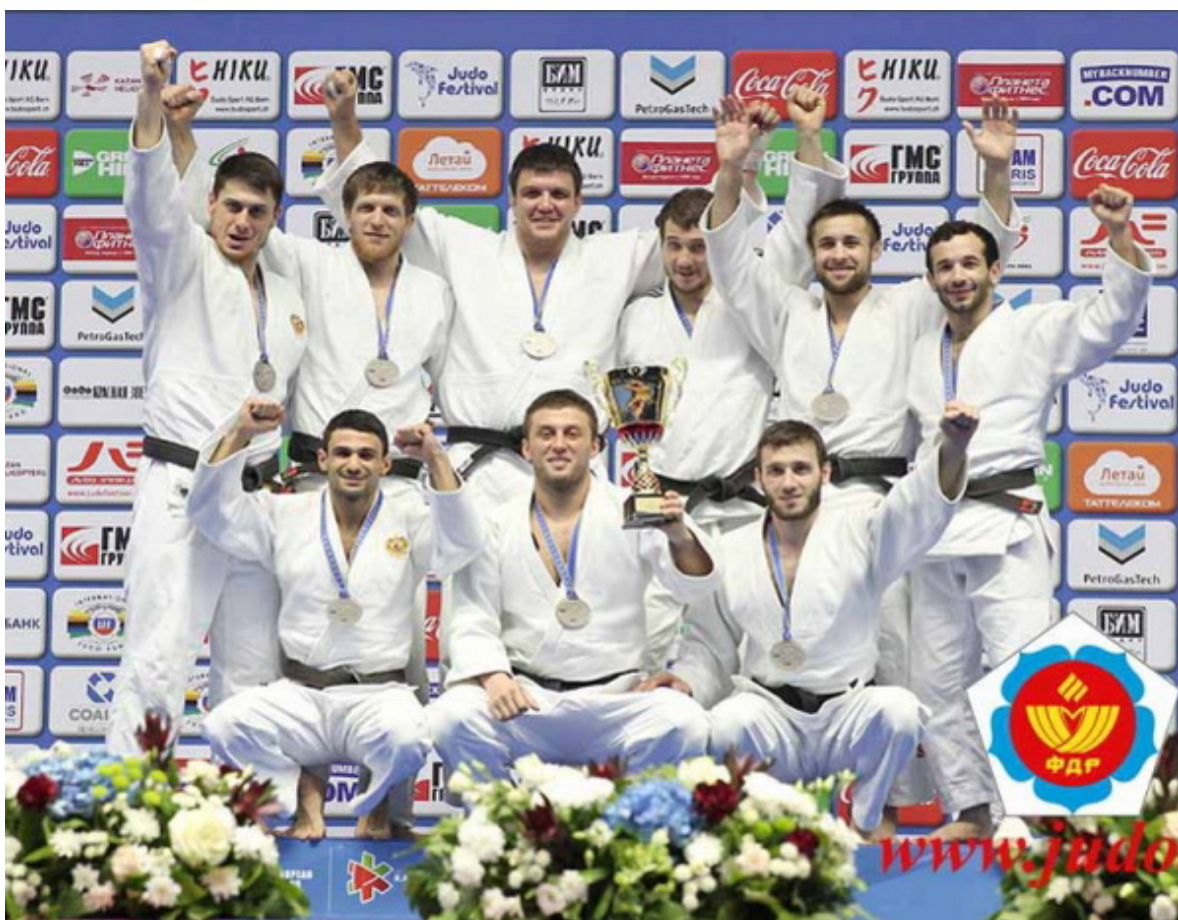
Сборная России 2-я на чемпионате Европы