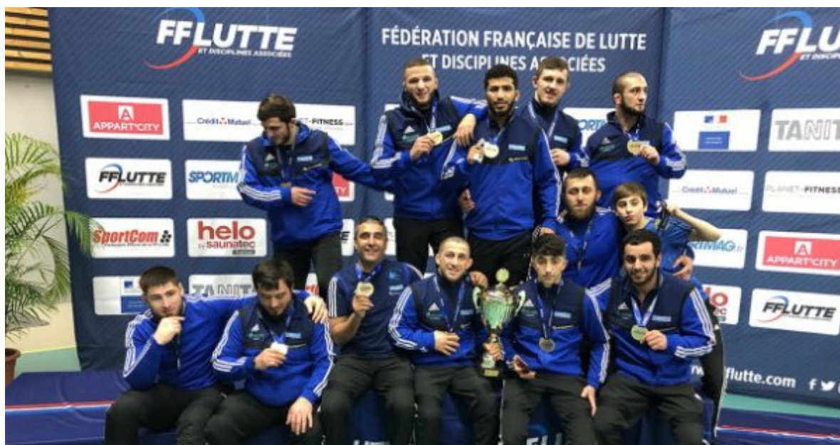
Клуб Сарргемина – 7-й чемпион Франции

Победив с общим счетом – 7:5, клуб Сарргемина в 7-й раз стал победителем клубного чемпионата Франции.