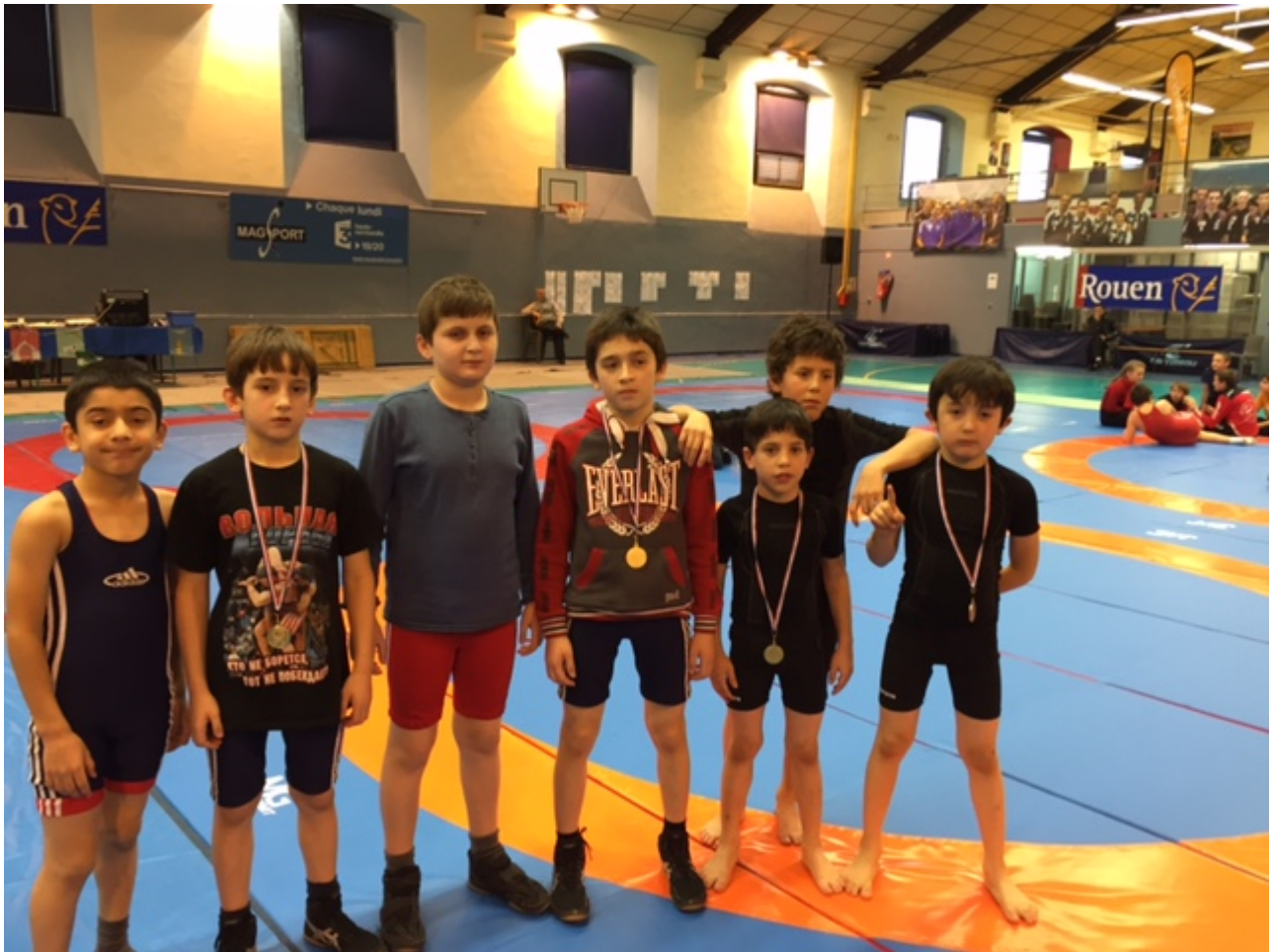
Чемпионы и призеры соревнований