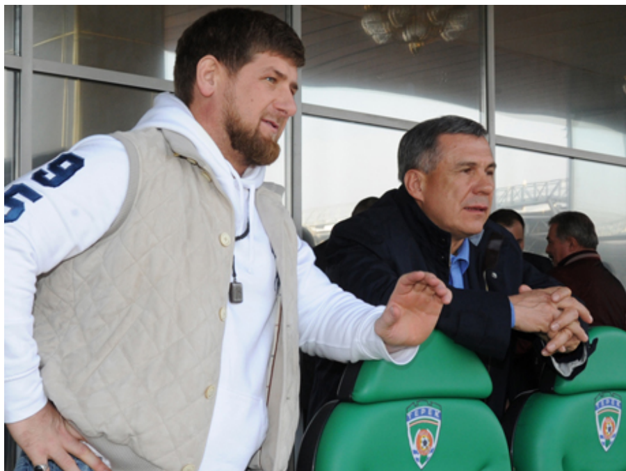
Рамзан Кадыров и Рустам Минниханов

заявление: «Президент Республики Татарстан Рустам Минниханов приносит свои извинения за некорректный видеоролик, размещенный на «Рубин-ТВ» и позволяющий проводить неоднозначные исторические параллели, связанные с чеченским народом. Рустам Минниханов заверяет, что этот инцидент и непродуманные действия служб, ответственных за пиар и пропаганду футбольной команды «Рубин», получают должную оценку. Как стало известно, ролик без согласования с руководством ФК «Рубин» разместила на «Рубин-ТВ» компания ОАО «Креатив Спорт». Контракт с этой компанией расторгнут, виновные в размещении видеоролика уволены».