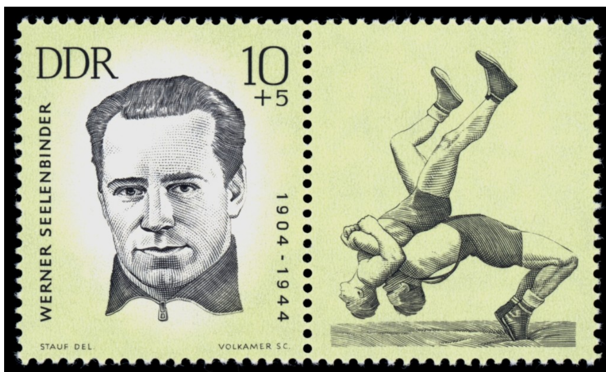
Почтовая марка, выпущенная в Германии в честь борца и

Надо сказать, что от рук фашистов гибли не только советские борцы. К примеру, в 1944 году гестаповцы за антифашистскую деятельность расстреляли известного немецкого борца полутяжелого веса Вернера Зееленбиндера – дважды бронзового призера чемпионата Европы по классической борьбе, немного не дотянувшего до пьедестала (4-е место) на XI Олимпийских играх 1936 года в Берлине. К слову, Зееленбиндер побеждал и на Спартакиаде народов СССР 1928 года, куда допускались иностранные борцы.