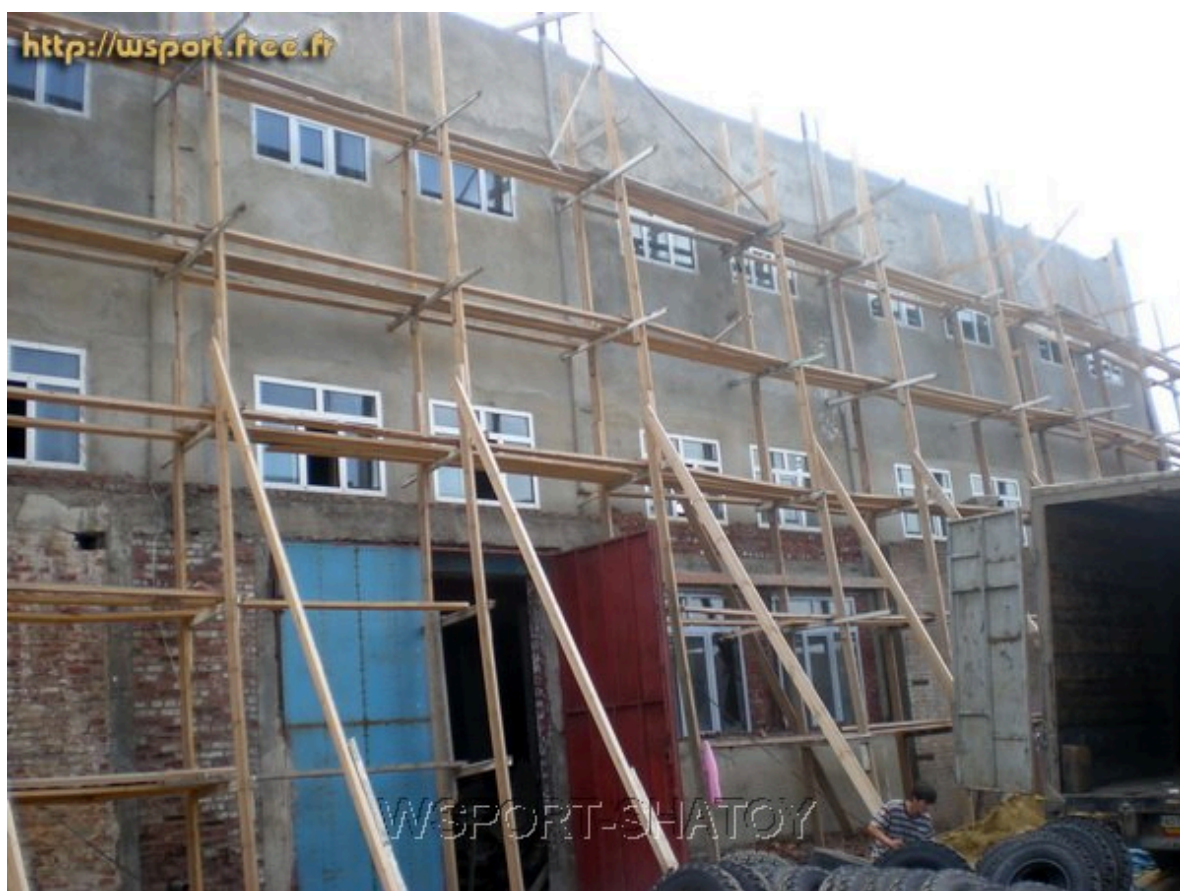
Строительство нового комплекса Школы им. братьев Сайтиевых

Ну, а сам Бувайсар и не думает успокаиваться. Некоторое время назад он взял в долгосрочную аренду большую территорию, примыкающую к школе и строит там спортивный комплекс. В скором времени Школа им.Сайтиевых значительно расширится. Новое 3-х этажное здание будет включать в себя огромный спортивный зал, гостиницу, столовую, подсобные помещения оборудованные по последнему слову науки и техники. Перспективные дети из разных сел и районов смогут жить и тренироваться в этом комплексе.