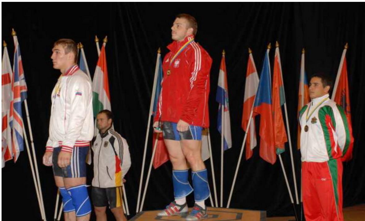
Чеченский атлет на второй ступеньке европейского пьедестала