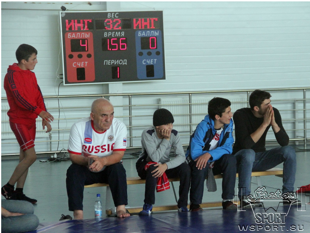
Турнир на призы Фонда "Планета" в Ингушетии 19 октября 2019г.