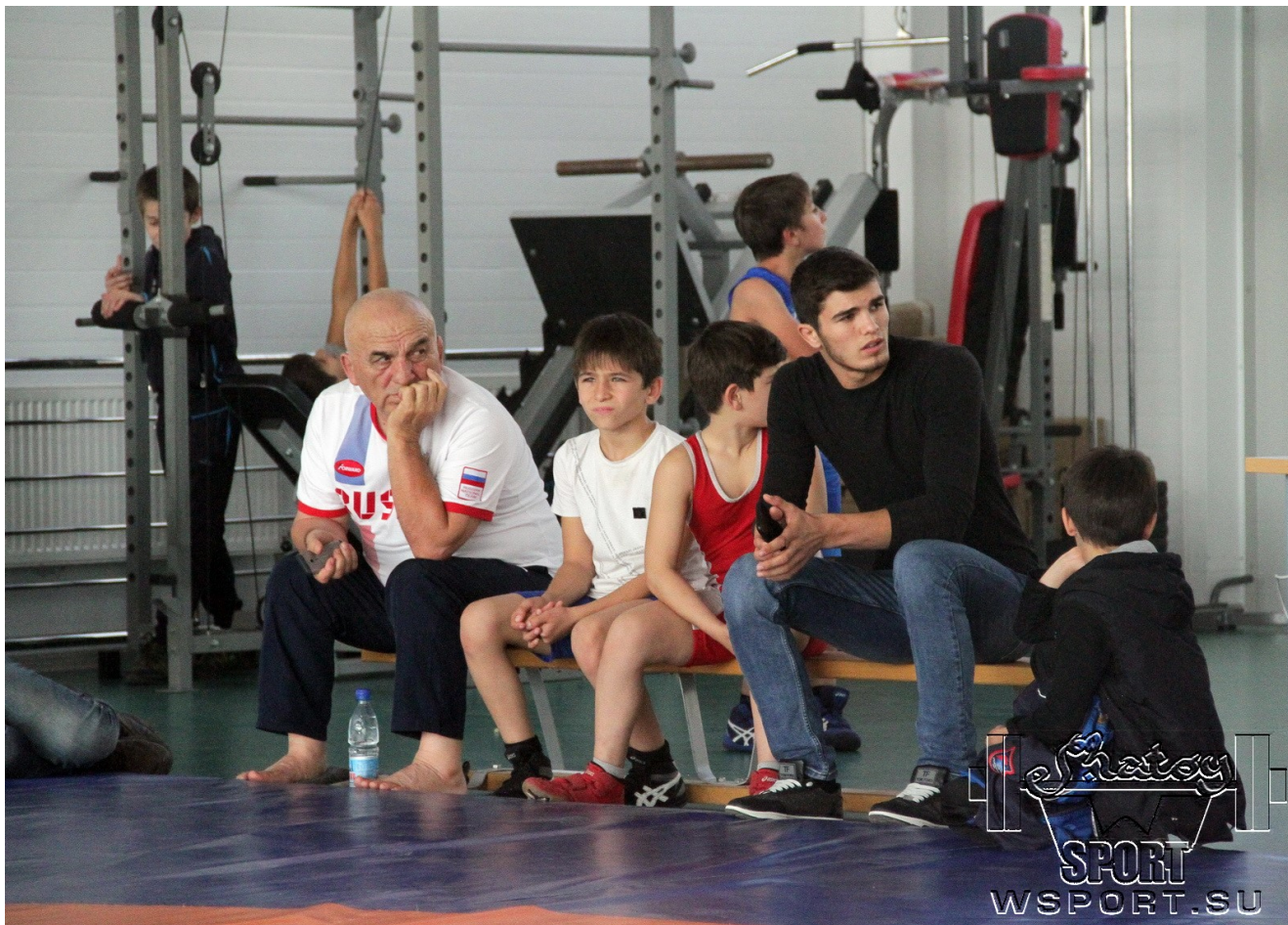
Турнир на призы Фонда "Планета" в Ингушетии 19 октября 2019г.