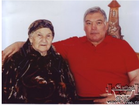
С мамой, 2013г.

– По примеру отца сыновья спортом не увлеклись?