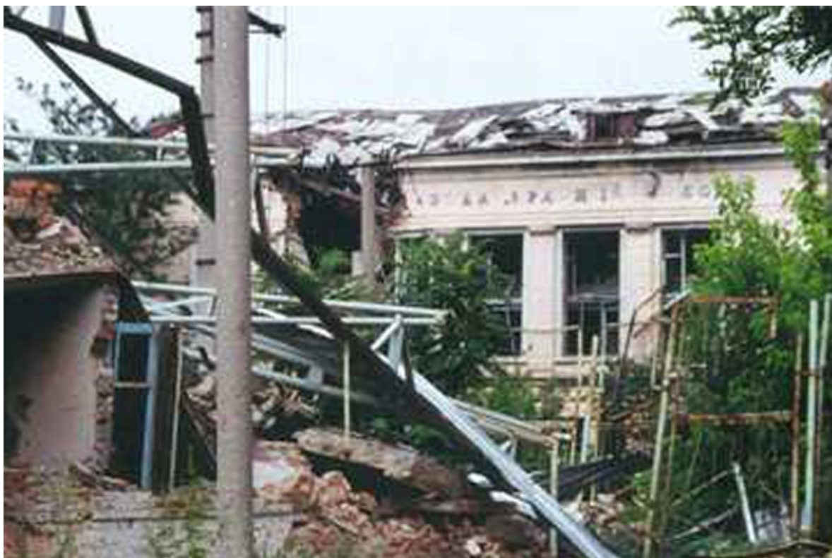
Дворец спорта завода «Красный Молот».