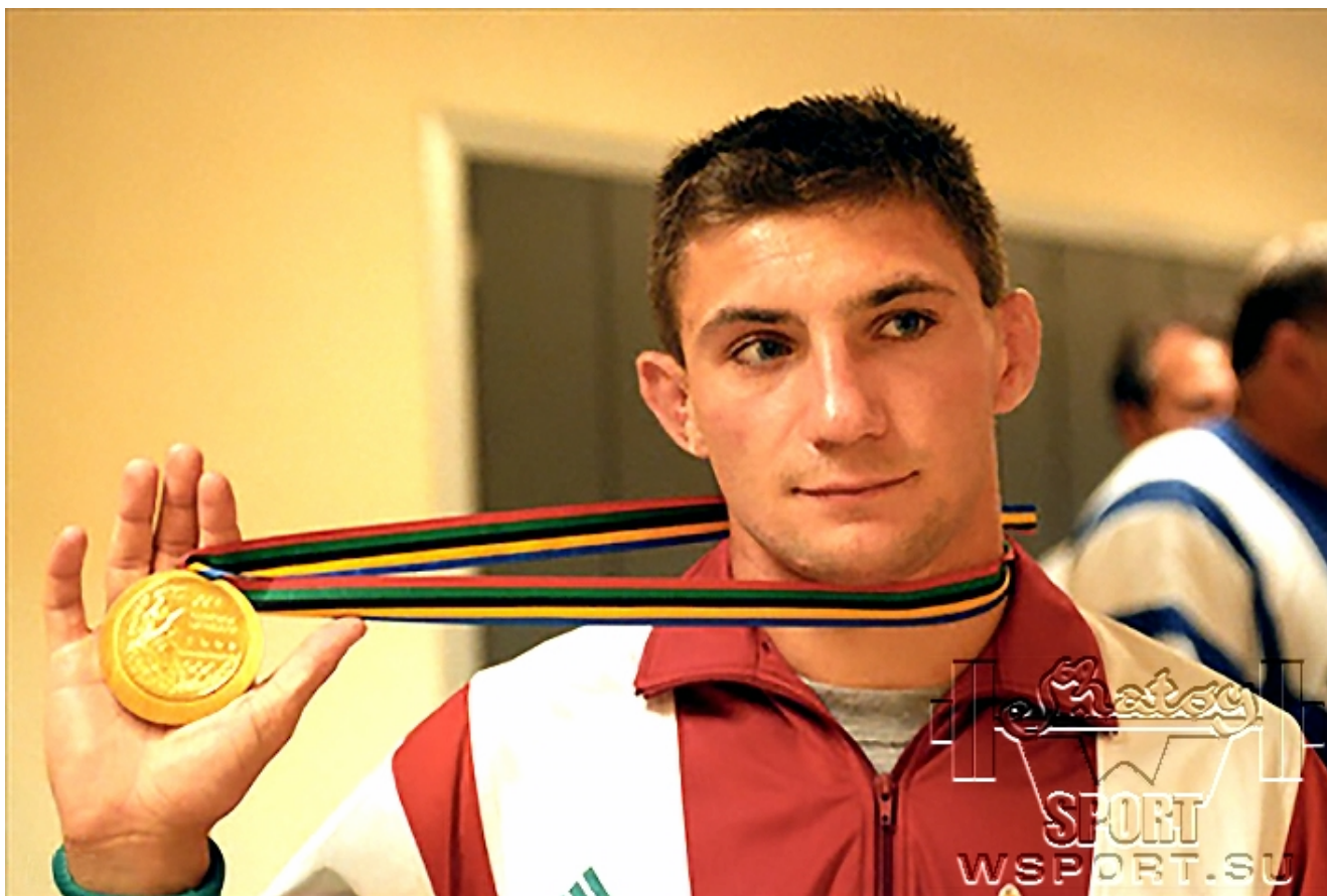
Аттила Репка (Венгрия).