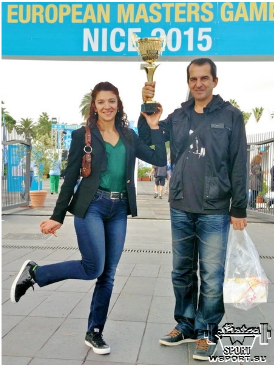
С Кубком за победу в абсолютном первенстве. Официальная деревня Европейских игр, 5 октября 2015г.