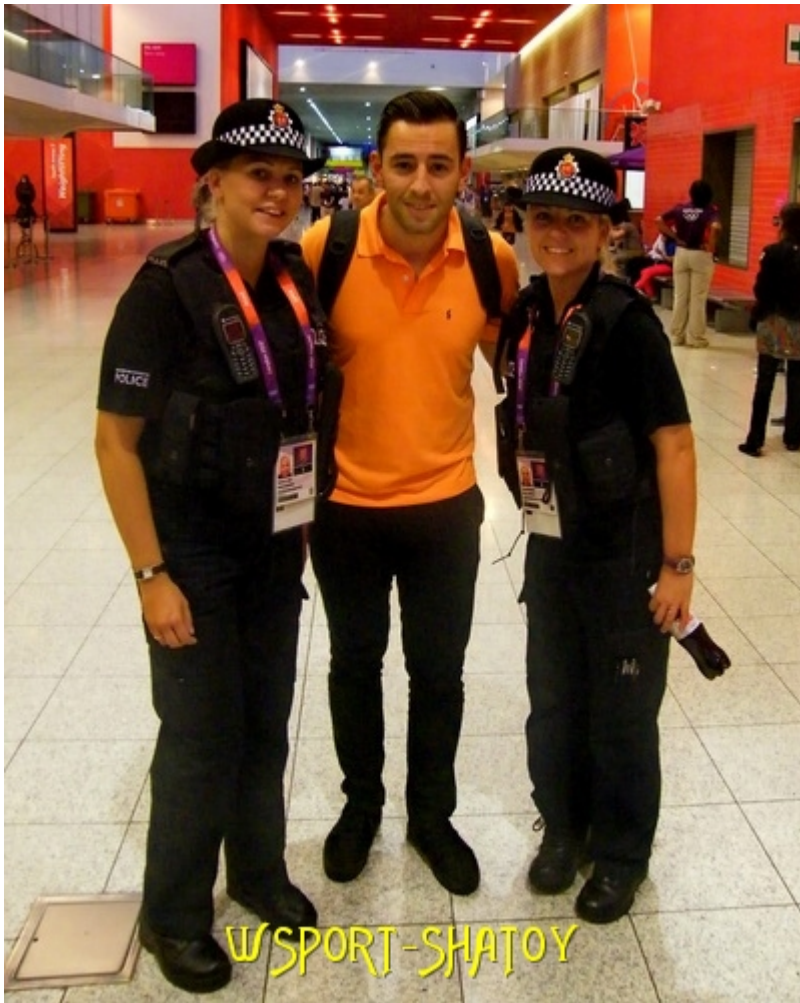
Красавицы - охранницы