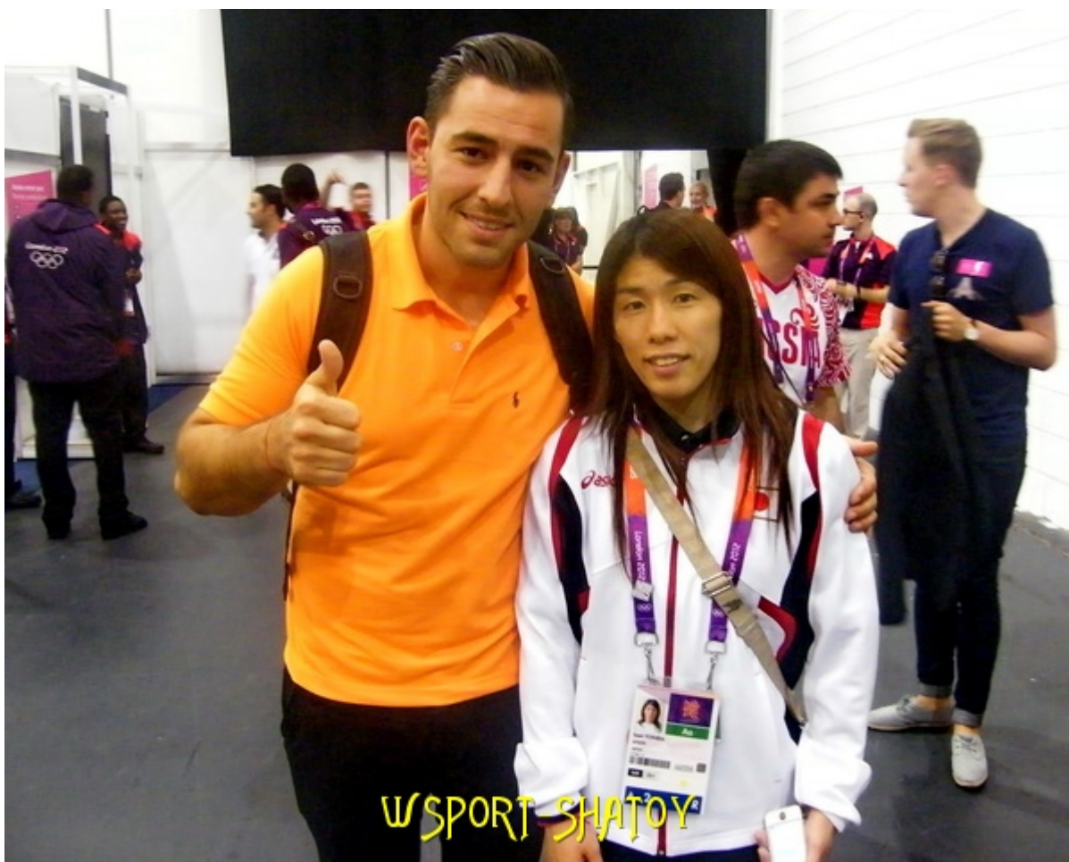
3-кратная олимпийская чемпионка Саори Йошида (Япония)