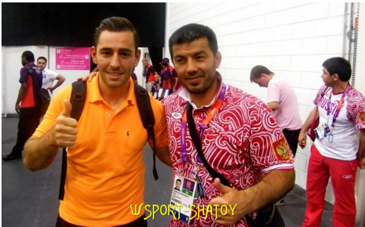
С тренером сборной России, олимпийским чемпионом Атланты-96 Хаджимурадом Магомедовым