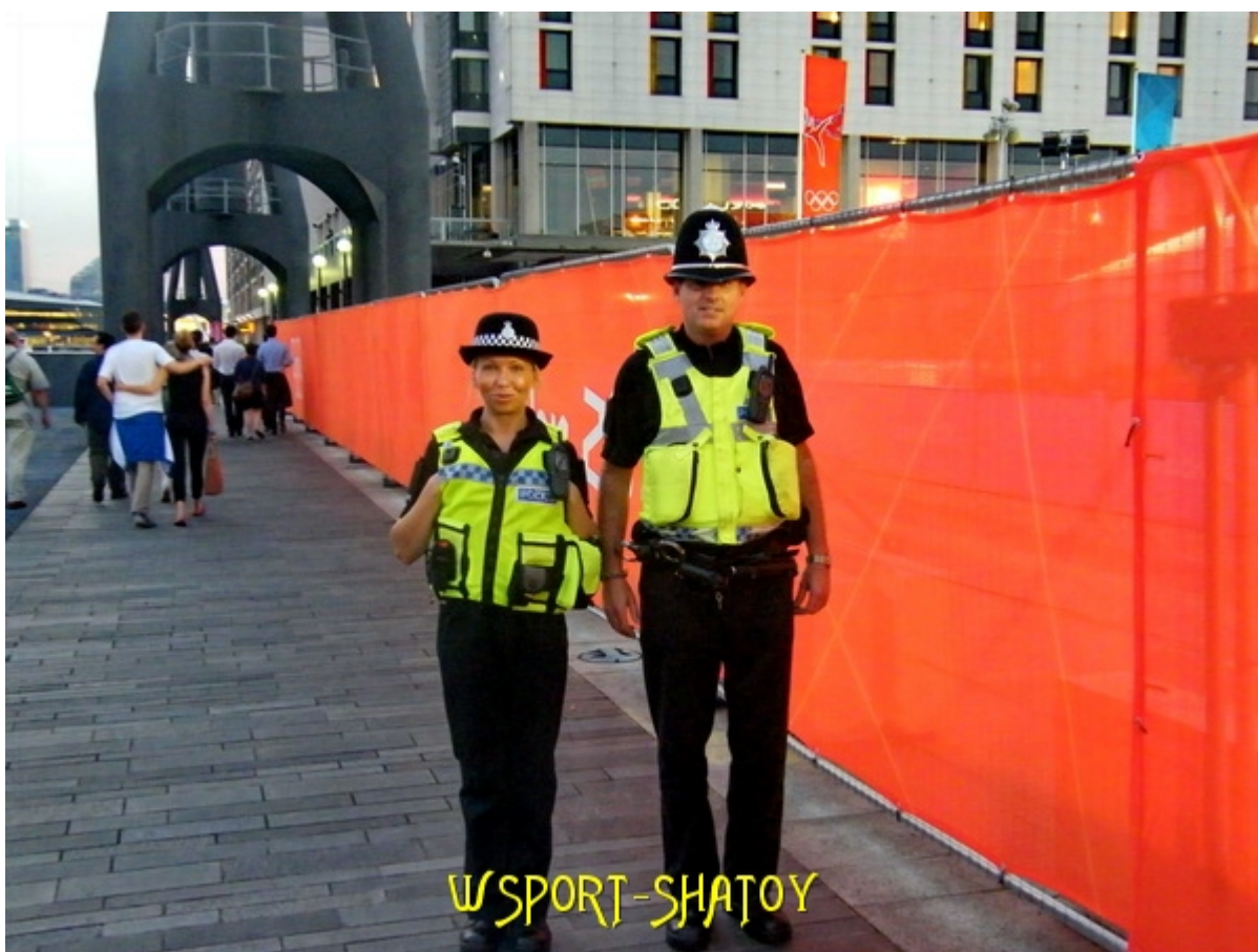
Олимпийцы под надежной охраной