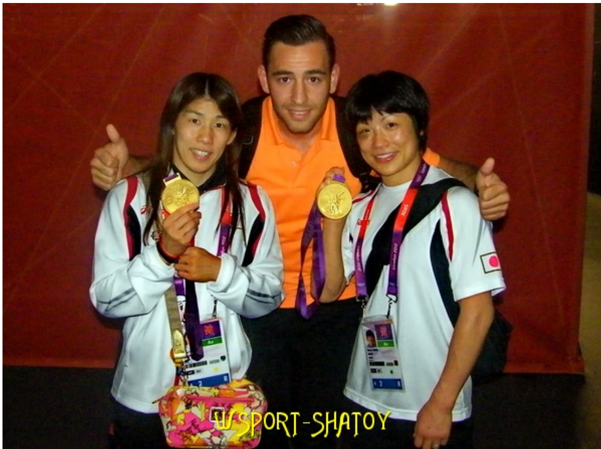
3-кратная олимпийская чемпионка Саори Йошида и олимпийская чемпионка Хитоми Обара