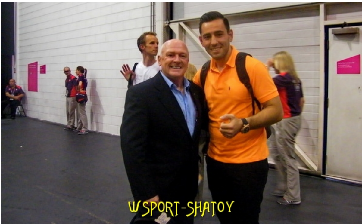
С телеведущим борцовских соревнований