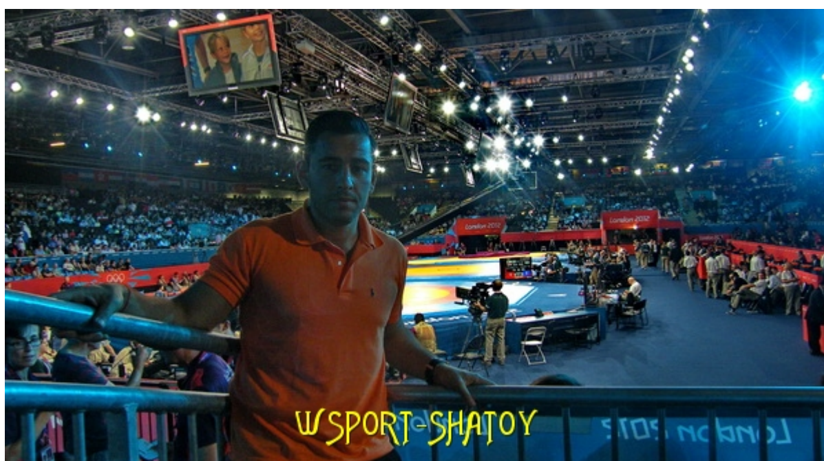
На соревнованиях по борьбе

Предлагаем читателям фоторепортаж Ислама Абдулаева из Лондона.