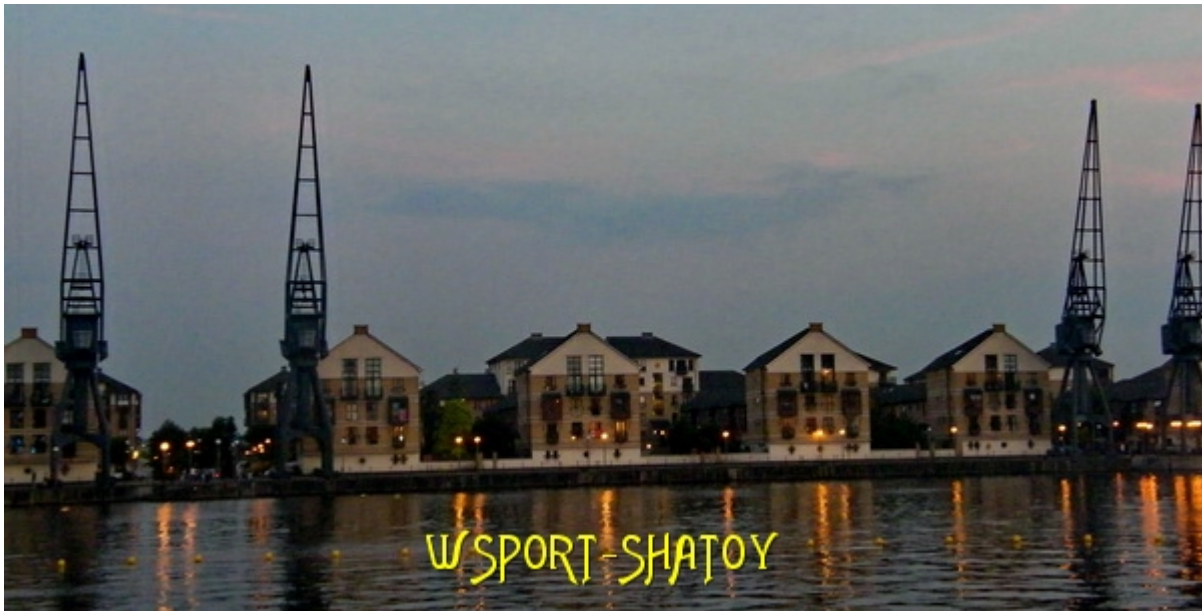
Вид от EXCEL через Темзу