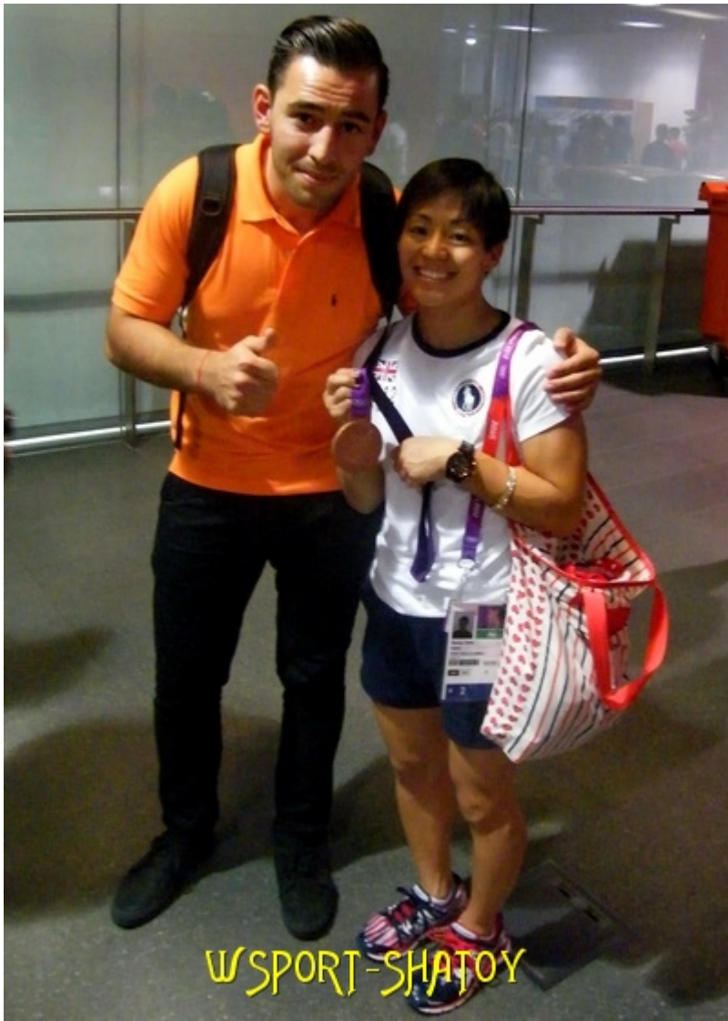
Бронзовая призерка Олимпиады Кларисса Чэнь (США)