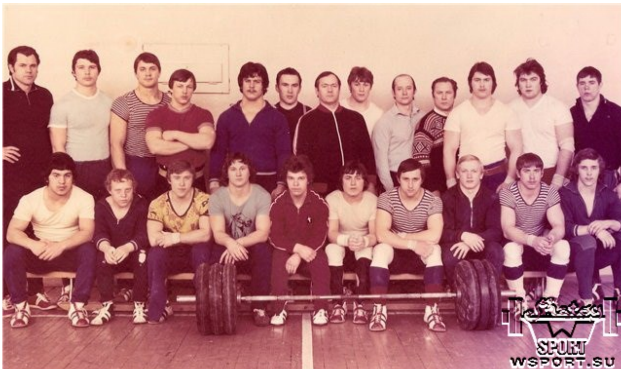
Юниорская сборная СССР, 1976г.