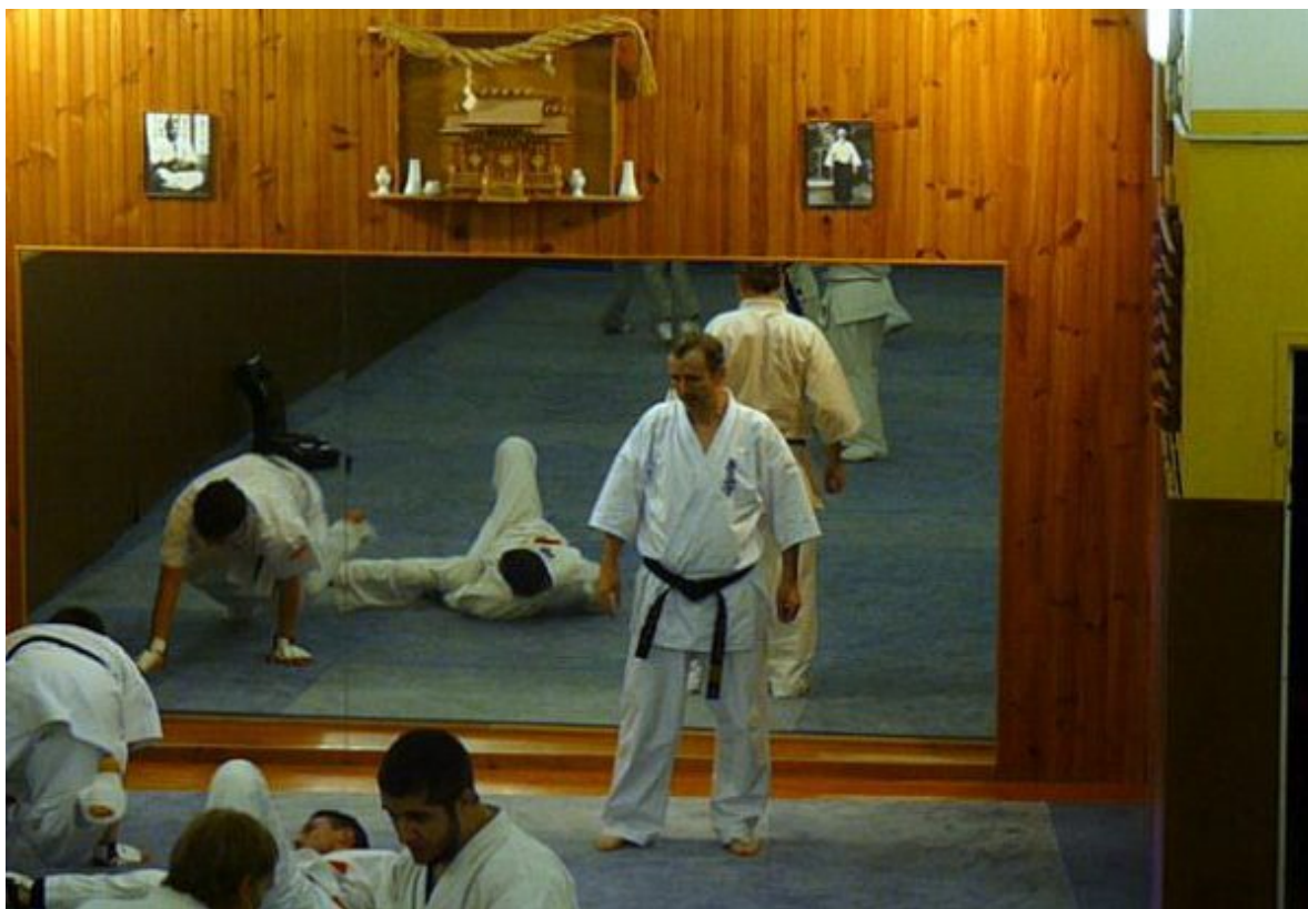
В клубе карате г.Ниццы

«Моя политика – это дети, мир и дружба и моя идеология – это милосердие и сострадание».