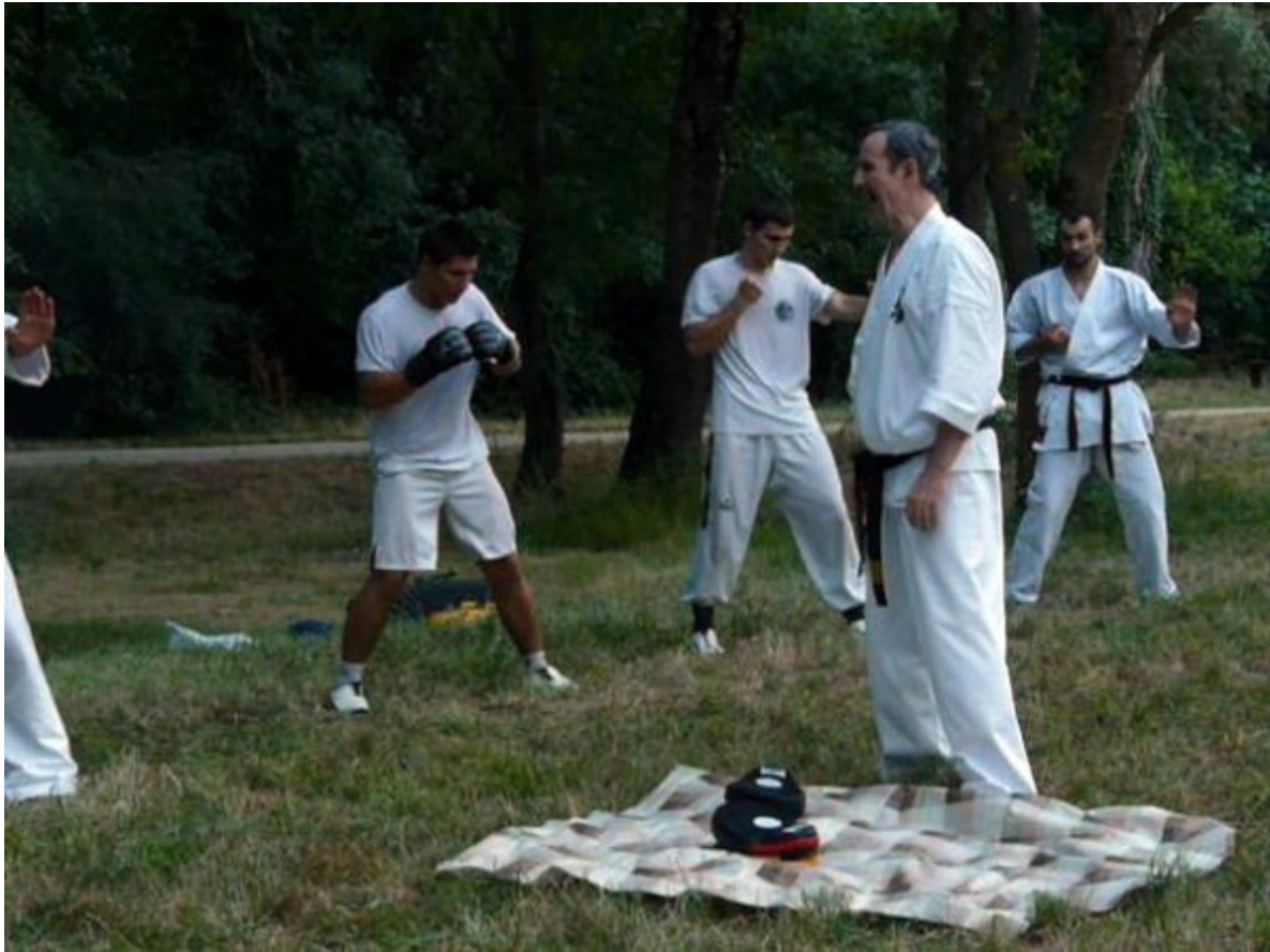
Тренировки на природе.