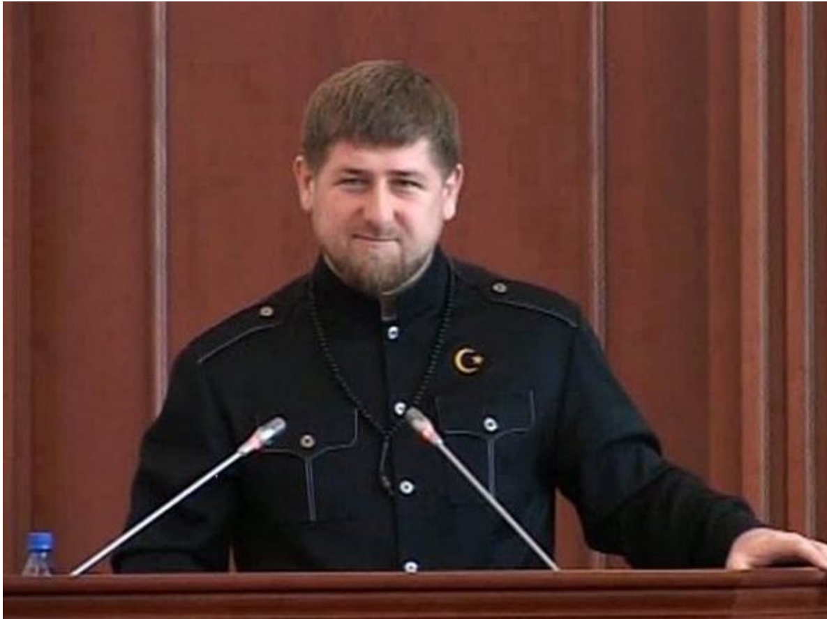
Глава Чеченской Республики Рамзан Ахматович Кадыров

Именно на него возлагаю самые большие надежды и непоколебимо верю, что он, как достойный мусульманин и вайнехан Къонахо, вместе с чеченскими бизнесменами и своим окружением бескорыстно поможет мне ради Аллаха – иншаАллах. Также, как он помогает многим. Надеюсь, что таким же образом поступят и наши братья – ингушские Къонахой в лице бизнесменов и руководства Ингушетии. Потому что мы не только братья по Вере, но и исторически. Кто бы и как бы не хотел – мы братья по крови, один Вайнахский Народ – иншаАллах. И я очень надеюсь и верю, что наши братья не забудут, что на кону этой просьбы здоровье и жизнь вашего тяжело больного брата по Вере, тренера–инвалида и волонтера ради Аллаха и детей и его сына–инвалида. Причина поспешности моей просьбы в скоротечности и безвозвратно уходящем времени, здоровье и отсутствии средств для дальнейшего существования, что усугубляет положение моё и моей семьи и торопит с действиями, а на всё остальное воля Аллаха – иншаАллах.