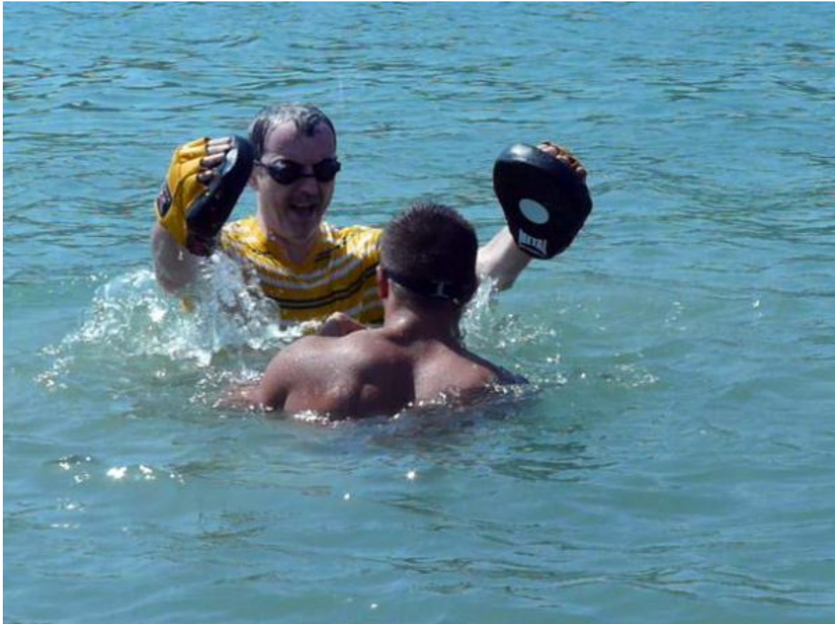
Тренировки в воде.