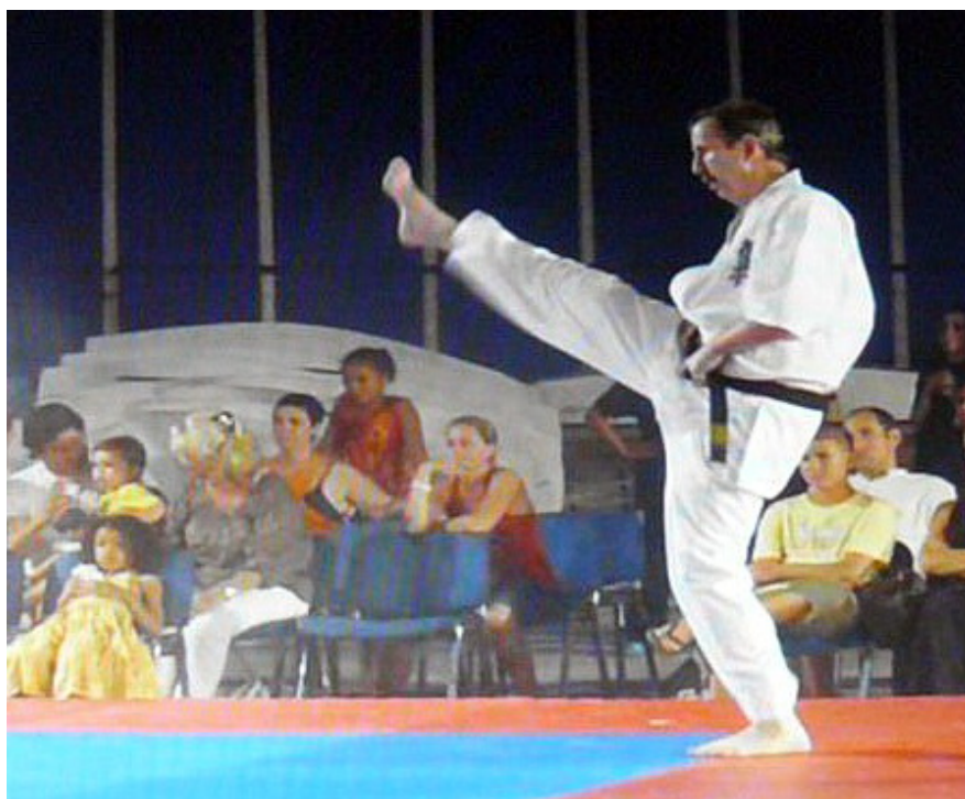
На Фестивале боевых искусств в Ницце.

очень благодарен ему за то уважение, которое он проявил по отношению ко мне и как человек, и как брат по Вере, и как мастер высочайшего ранга.