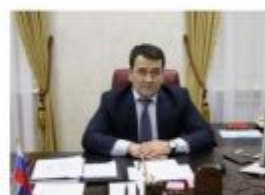
Цесоев Алишан Израилевич Заместитель Председателя Правительства Республики Ингушетия – постоянный представитель