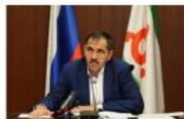
Евсуров Юнус-Бек Баматгиреевич Глава Республики Ингушетия

«Занимаемся мы и вольной, и греко-римской борьбой, у нас уже есть чемпионы Швеции по обоим стилям борьбы. В нашем клубе три возрастных группы –