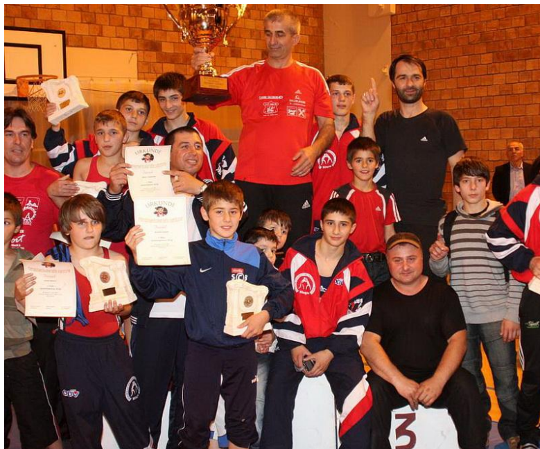
Главный Кубок турнира уедет в Австрию