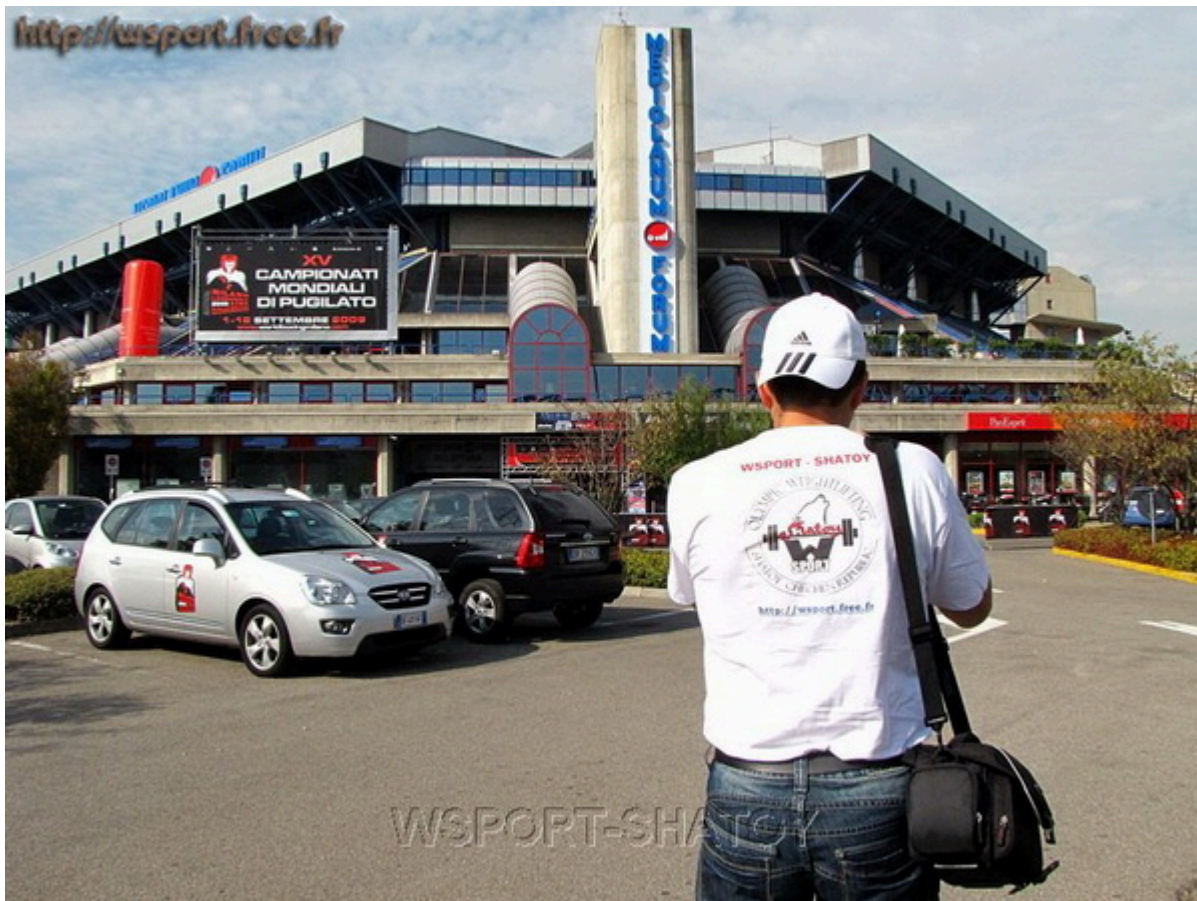
Спорткомплекс "Mediolanum Forum"