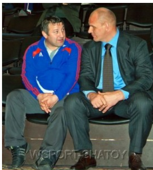
Ибрагим Шовхалов и Александр Карелин

После завершения спортивной карьеры Шовхалов не ушел из области спорта. В настоящее время он является президентом Федерации греко-римской борьбы Чеченской Республики. Его огромный опыт должен помочь в восстановлении в республике прежних победных традиций в греко-римской борьбе.