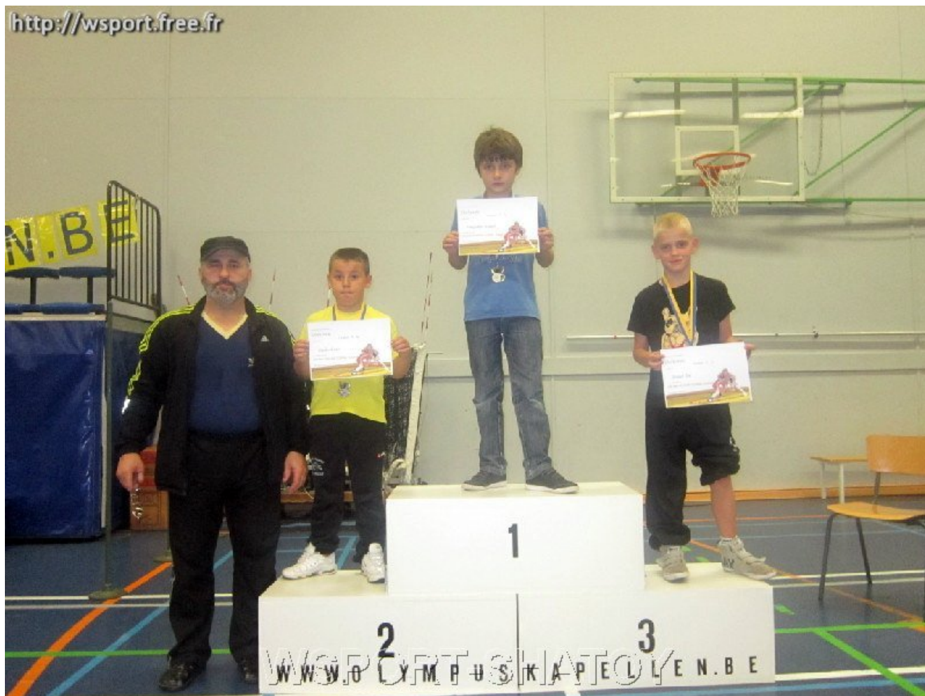
Чемпион Ахмед Ибрагимов