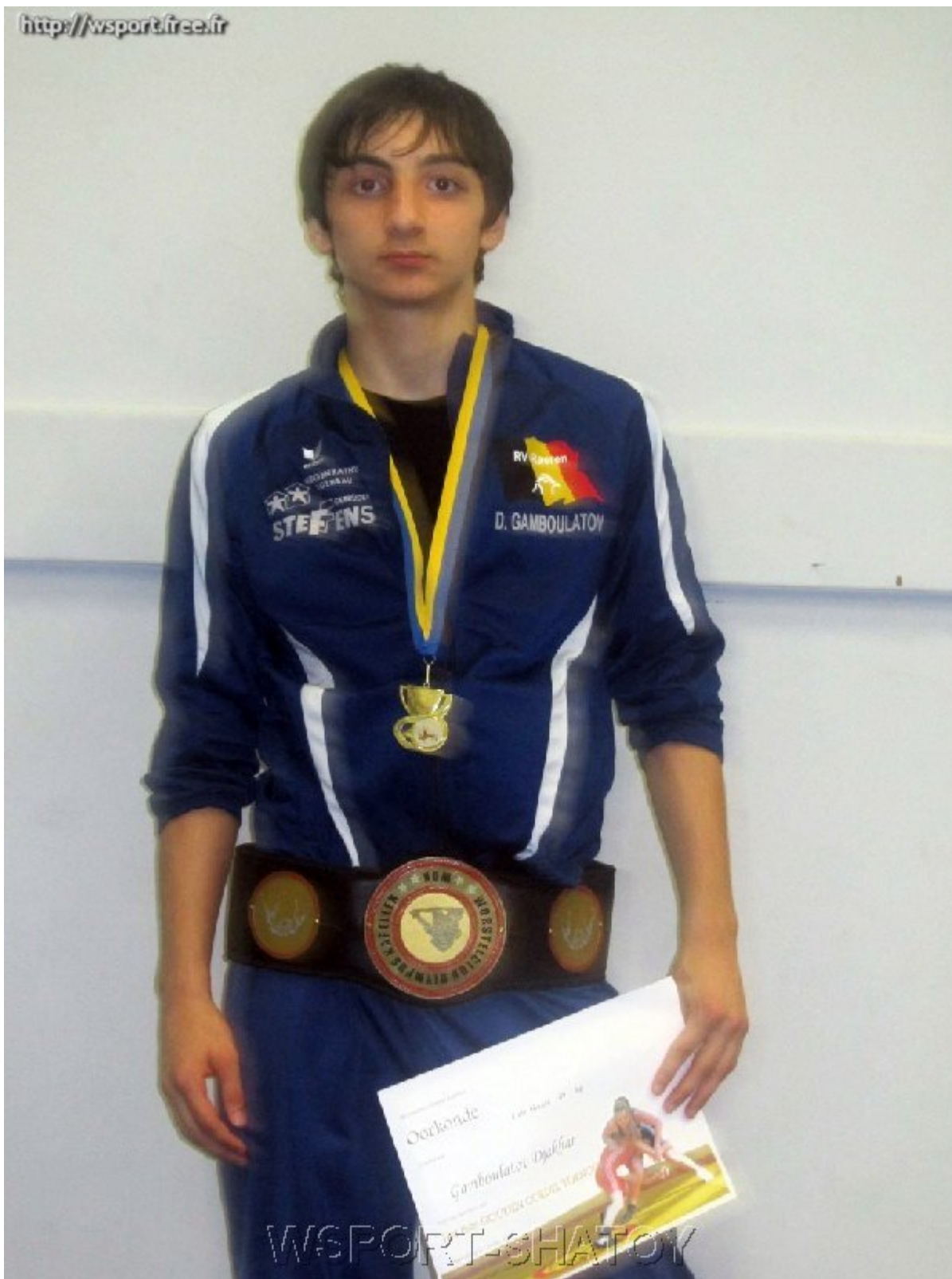
Обладатель "Золотого пояса" Джохар Гамбулатов