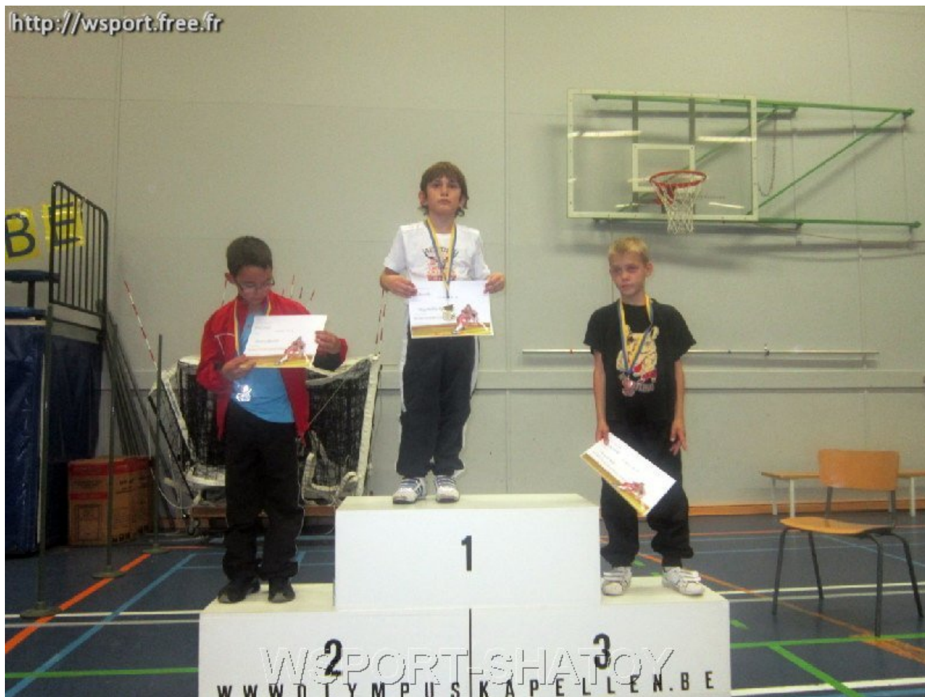
Чемпион Раджаб Магомедов