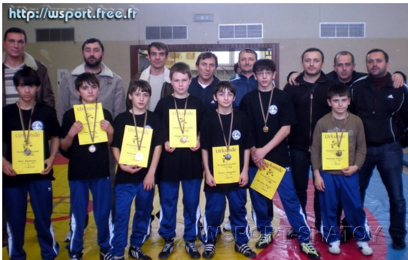
Спортсмены, тренеры, судьи, родители