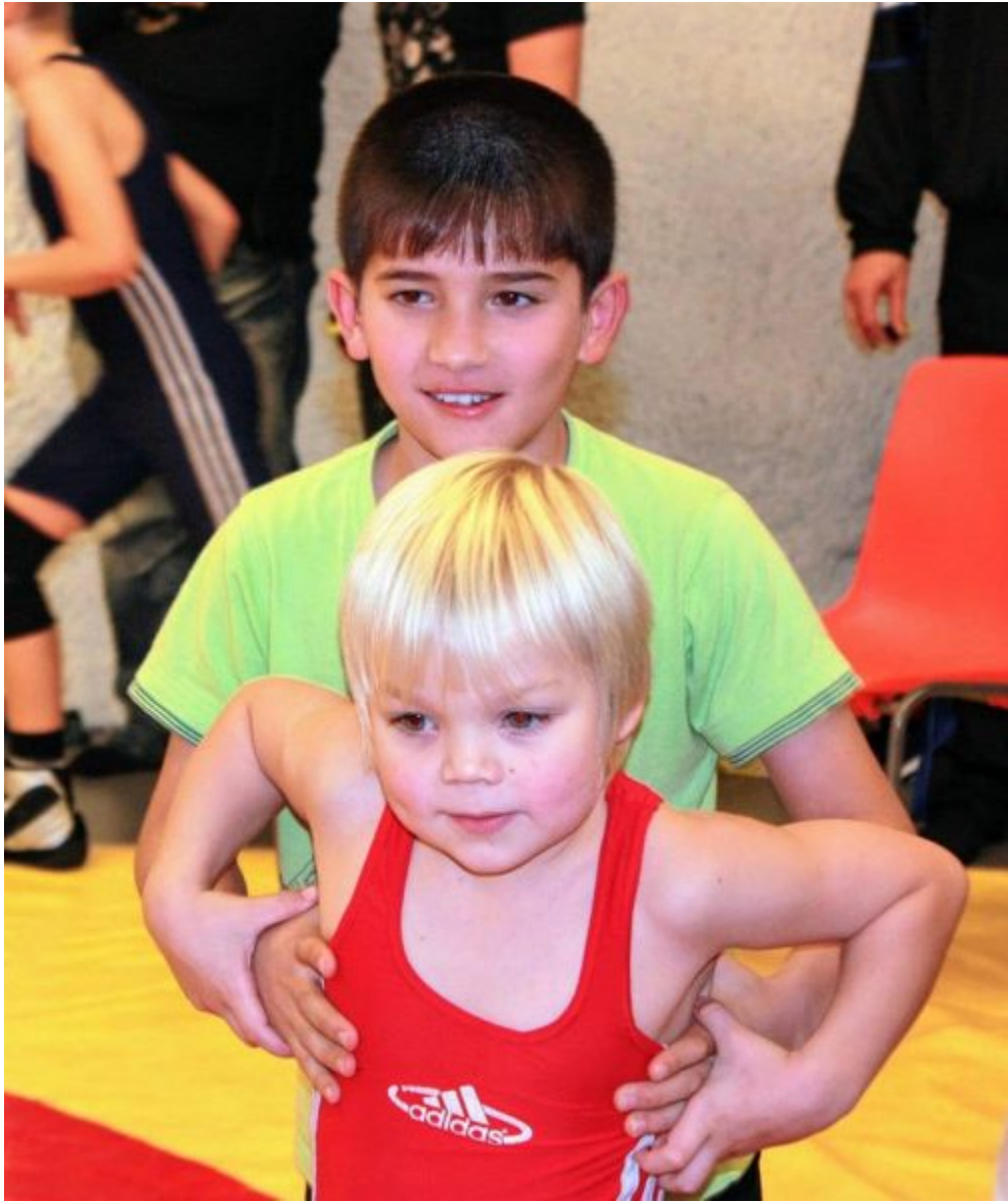
Первые шаги в спорте