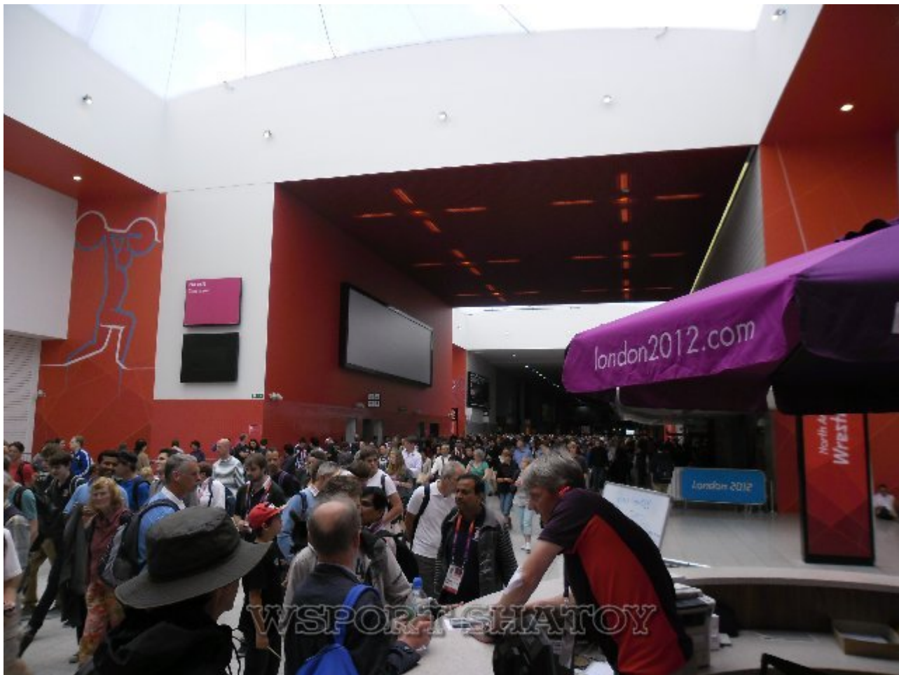
Холл Дворца спорта, где проходили соревнования борцов