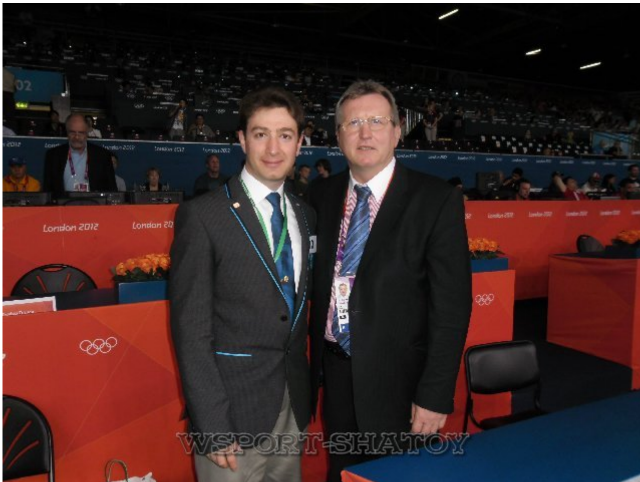
Айдамир и Чаба Хегедуш (Президент Федерации борьбы Венгрии и технический делегат FILA в Лондоне, олимпийский чемпион 1972 года в Мюнхене).