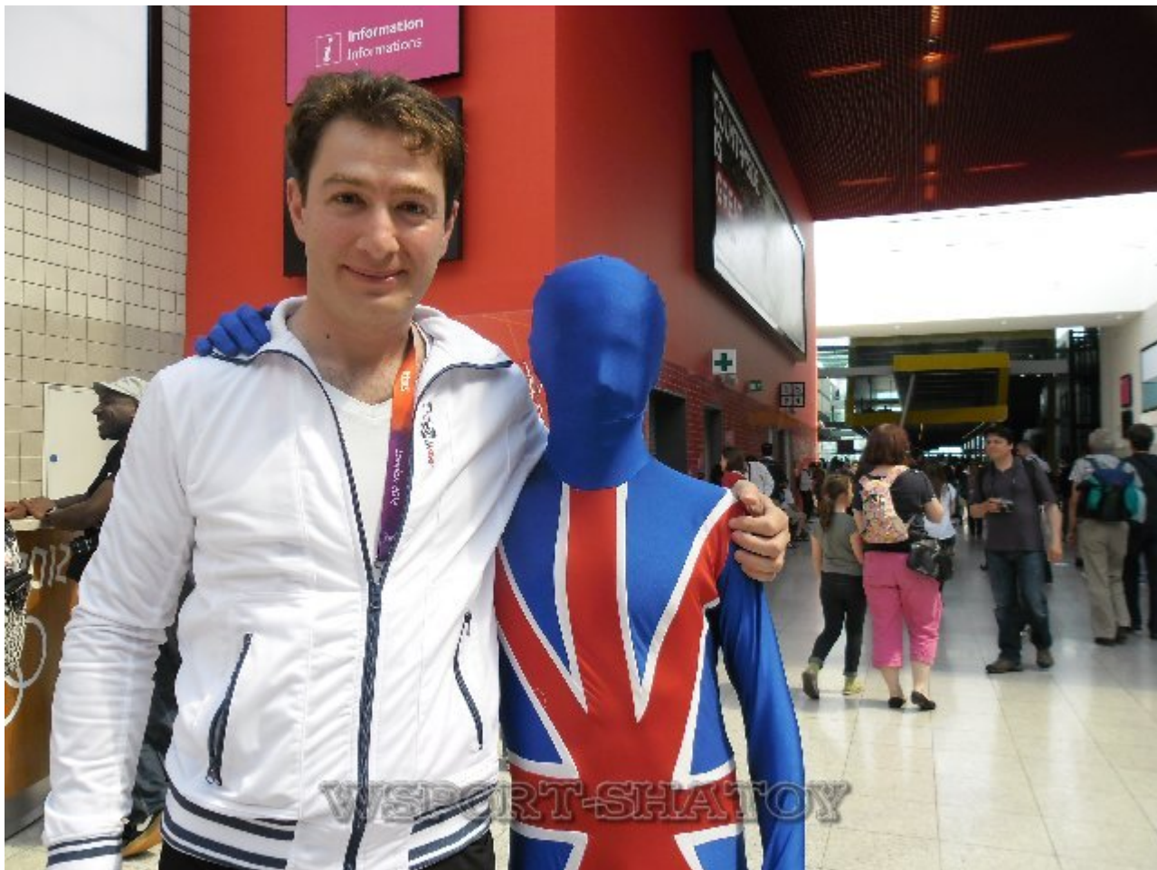
С британским болельщиком.