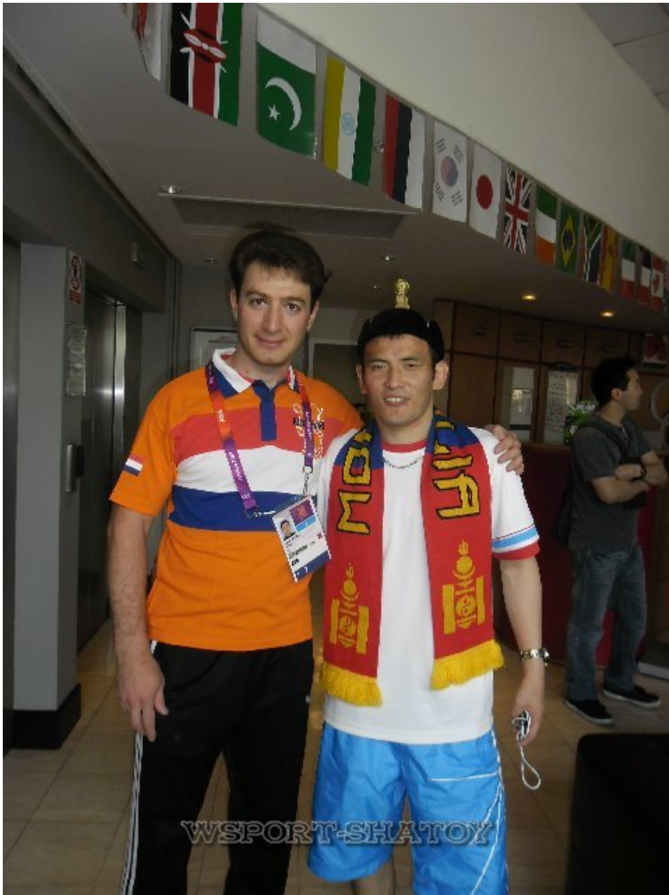
С монгольским болельщиком