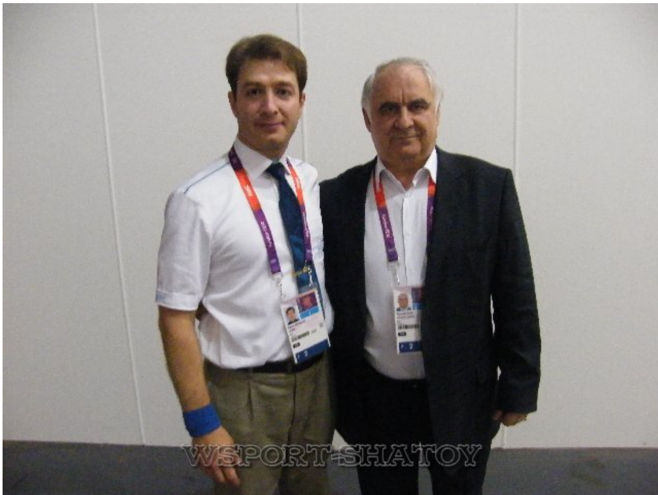
Айдамир и Зияудин Исаев – вице-президент ФСБР