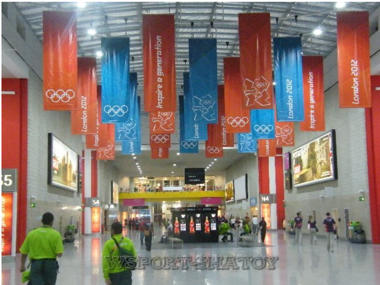
Холл Дворца спорта, где проходили соревнования борцов