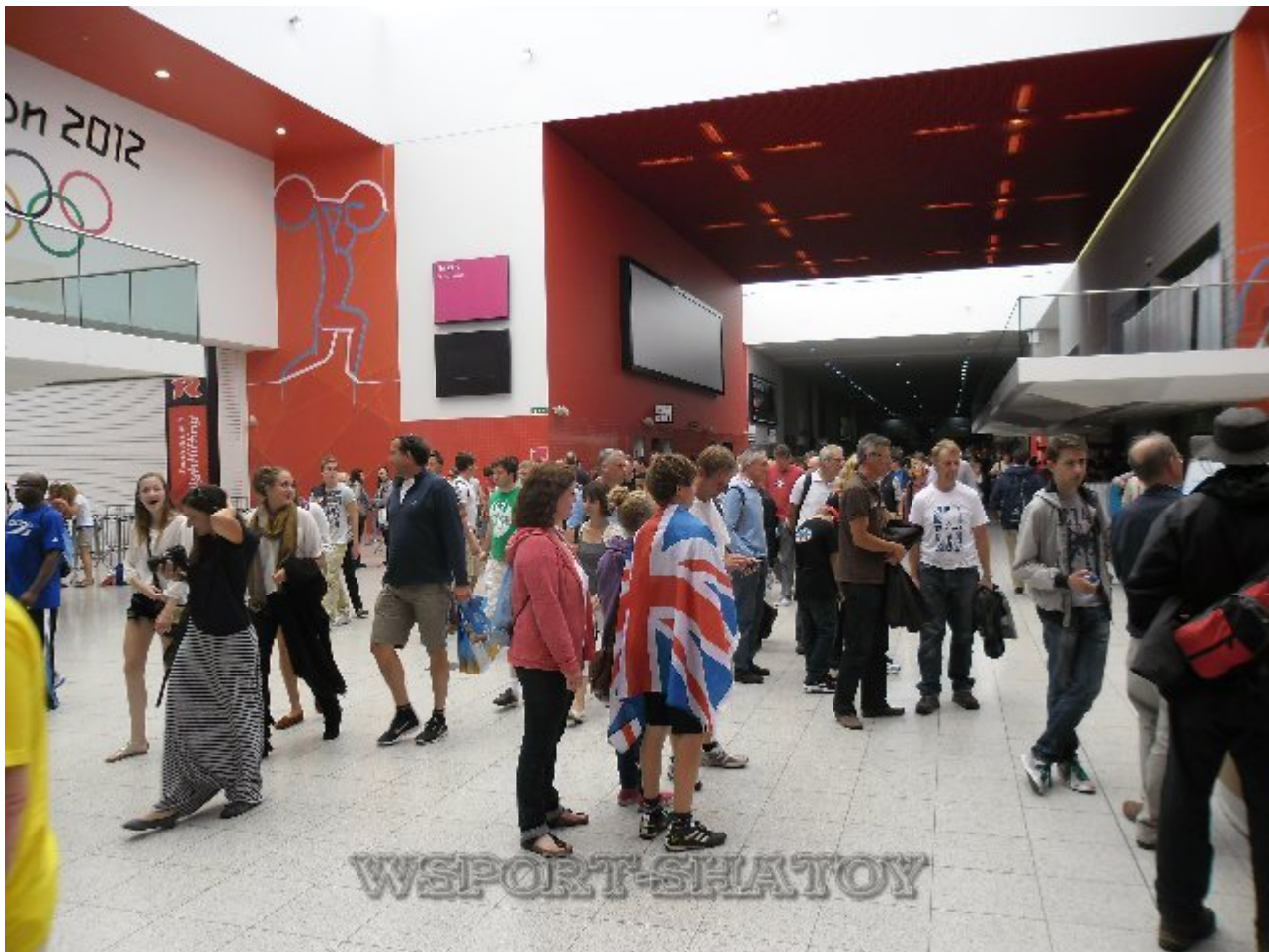
Холл Дворца спорта, где проходили соревнования борцов