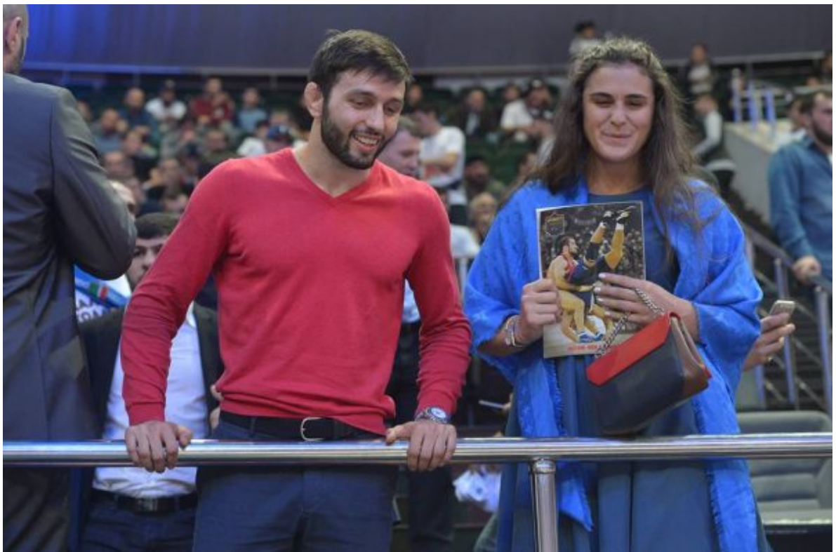
Гости турнира: олимпийские чемпионы Сослан Рамонов и