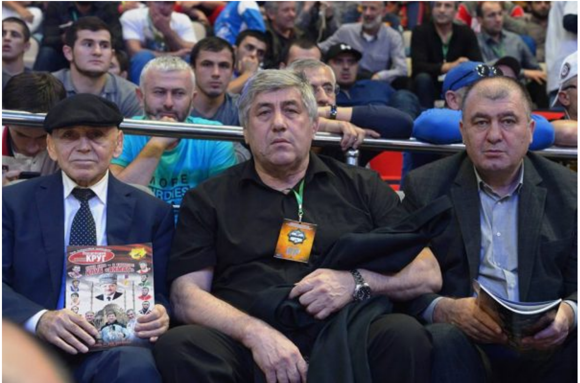
Гости турнира: первый олимпийский чемпион Северного Кавказа Загалав Абдулбеков, чемпион мира-1979 Хасан Орцуев, серебряный призер Олимпиады-1980 Магомедхан Арацилов.