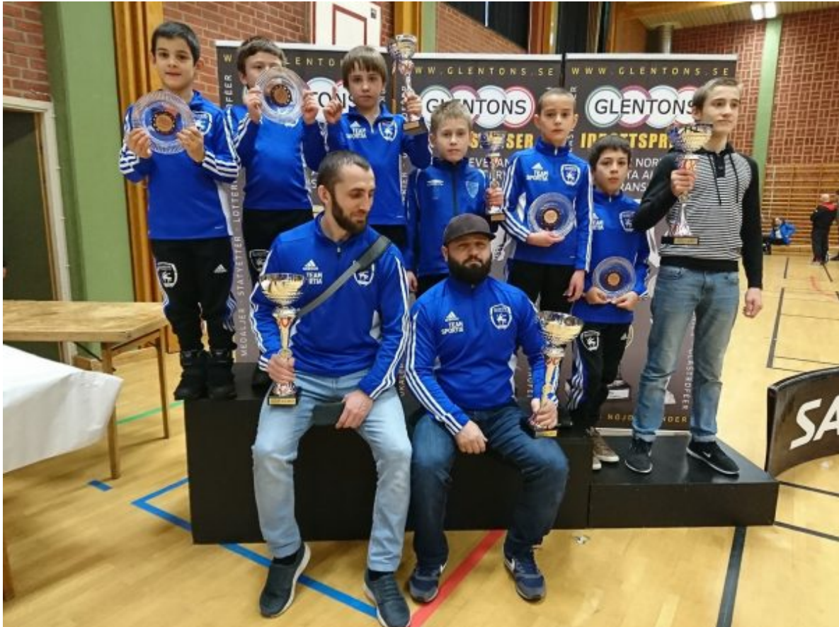
Вайнахские спортсмены из Швеции и Норвегии.