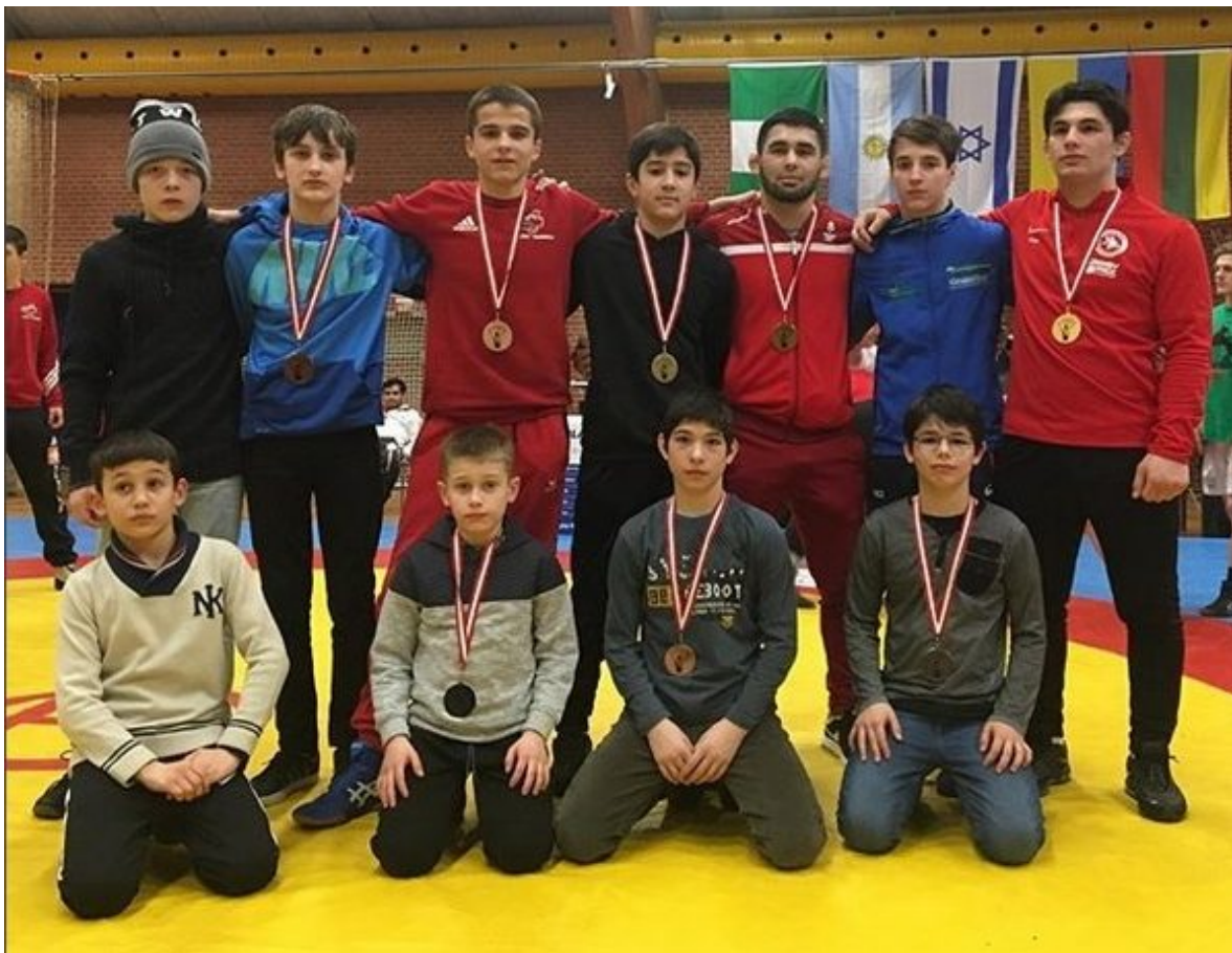
Вайнахские спортсмены на «Орхус Опен 2018».