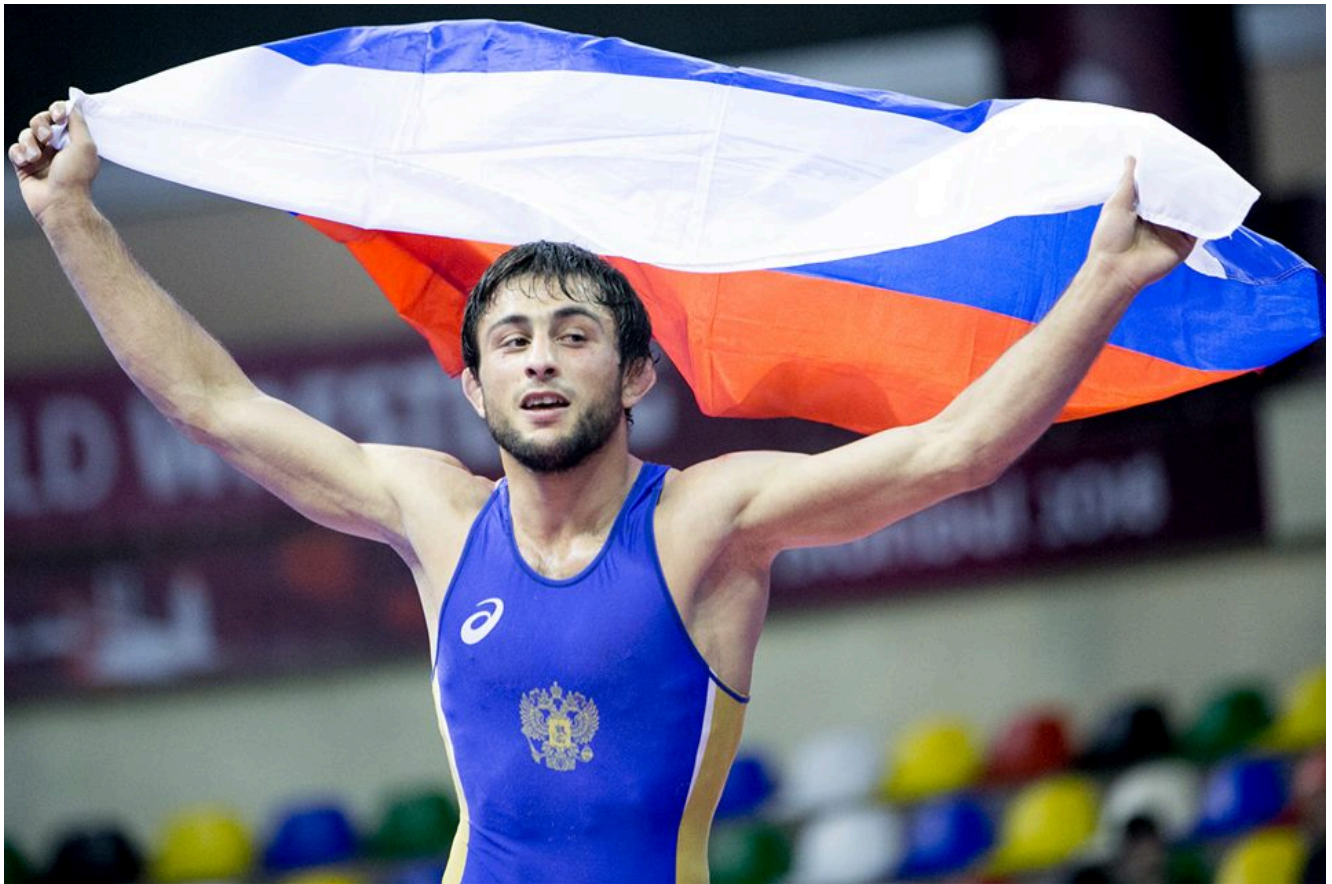
Ибрагим Ильясов - чемпион Европы-2018 среди молодежи до 23 лет